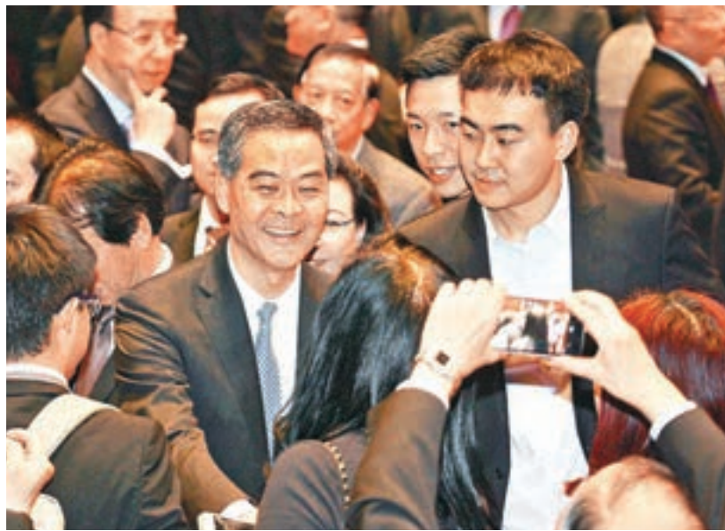
梁振英吸引眾多賓客拍照。