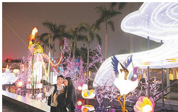
「桃花池畔鳳求凰」春節綵燈展，祝願天下有情人兩情相悅。

香港文匯報訊 (記者 文森) 農曆新年即將到來，其後緊接着中西情人節。康文署今日起在尖沙咀文化中心露天廣場舉行春節綵燈展，綵燈展配合雞年，以「桃花池畔鳳求凰」為主題，節目橫跨農曆新年及中西情人節至下月19日，設計師在綵燈展展現五彩鳳凰與一眾靈鳥飛翔於桃花之間，祝願天下有情人兩情相悅。