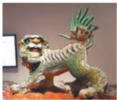
製作於1935年的香港剪瓷獅。