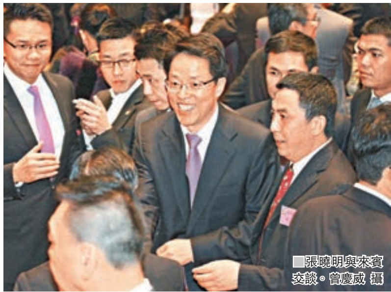
張曉明與來賓交談。