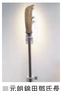
元朗錦田鄧氏長春園練武鐵關刀。