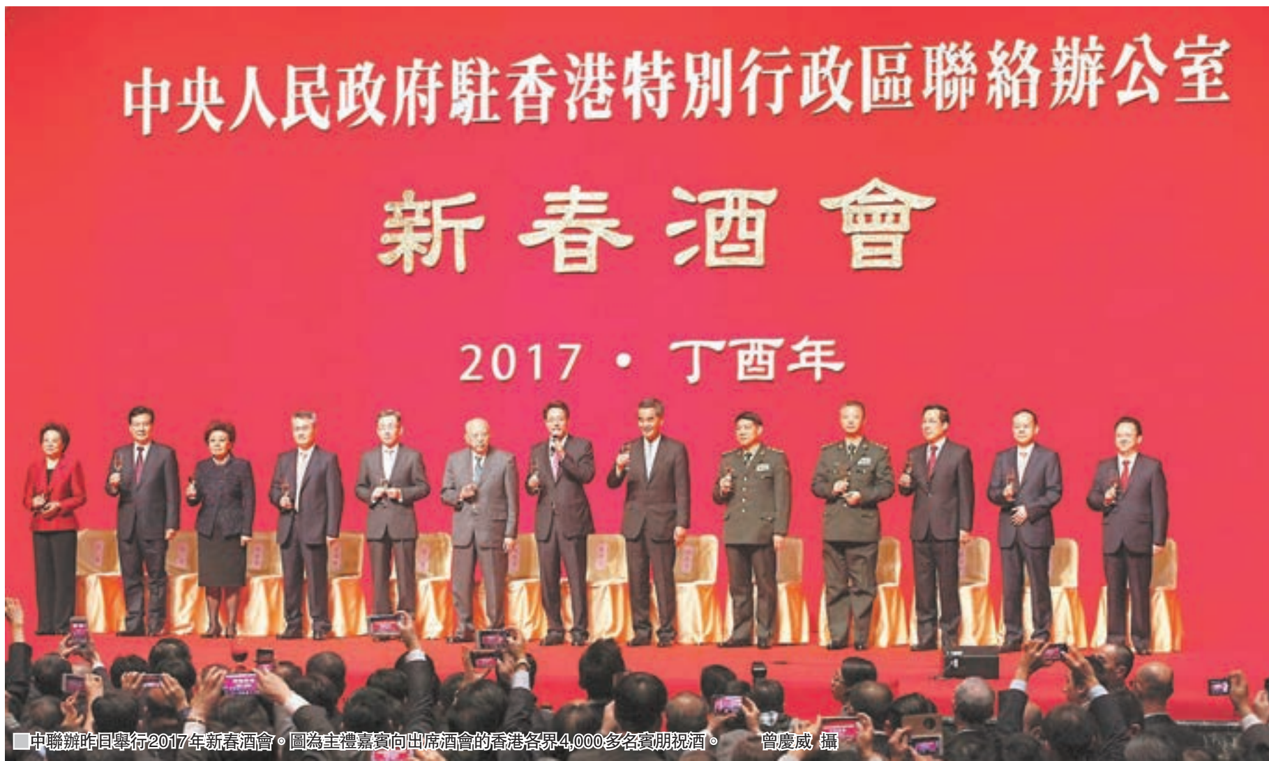
中聯辦昨日舉行2017年新春酒會。圖為主禮嘉賓向出席酒會的香港各界4,000多名賓祝酒。