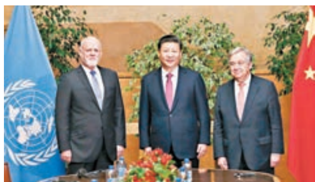
習近平會見第71屆聯合國大會主席湯姆森（左）和聯合國秘書長古特雷斯（右）。

香港文匯報訊 據新華社報道，中國國家主席習近平當地時間18日在日內瓦萬國宮會見第71屆聯合國大會主席湯姆森和聯合國秘書長古特雷斯，強調中國堅定走多邊主義道路，捍衛聯合國憲章宗旨和原則，支持聯合國為維護世