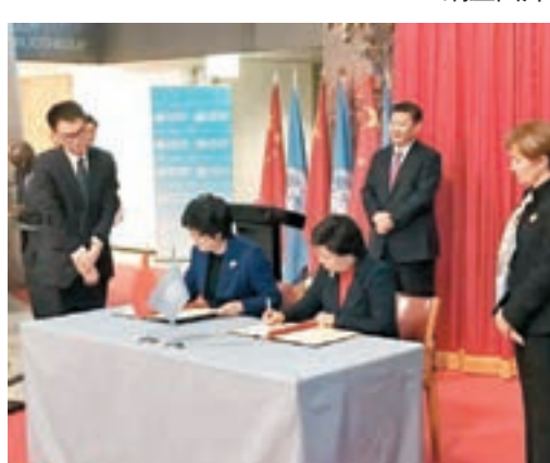
習近平見證中國政府和世衛組織簽署「一帶一路」衛生領域合作諒解備忘錄。