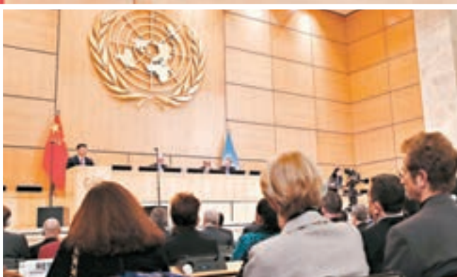
「共商共築人類命運共同體」高級別會議現場。

和平外交政策，在和平共處五項原則基礎上同所有國家發展友好合作。中國將進一步聯結遍布全球的「朋友圈」。中國支持多邊主義的決心不會改變，將堅定維護以聯合國為核心的國際體系，堅定維護以聯合國憲章宗旨和原則為基石的國際關係基本準則，堅定維護聯合國權威和地位，堅定維護聯合國在國際事務中的核心作用。