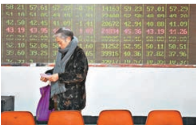
滬綜指昨收報3,113點,微漲0.14%。中新社

鋼鐵股表現最佳,方大特钢、柳鋼股份等漲停,其餘多股漲幅皆超過4%,消息層面上央企要化解鋼鐵過剩產能問題,目前國家正在編制2017年鋼鐵煤炭去產能方案。酒類指數高開高走,分類內可交易的個股中八成上漲,伊力特、五糧液、水井坊