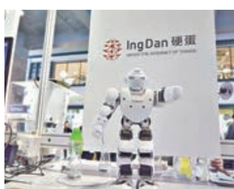
硬蛋展示平台上最熱門的智能硬件項目Alpha 1 機械人。

硬蛋作為是次活動的策略夥伴,亦攜同平台上最熱門的智能硬件項目包括Alpha 1 機械人、Mobileye 先進駕駛輔助系統及小愛AI 智能影音產品,亮相畢馬威和智慧城市聯盟在元創方舉辦的The Connected City 活動,展示與智慧城市及生活息息相關的創新發明。以來自世界各地的科技實例,說明如何提高城市的宜居度、可行性和可持續性。