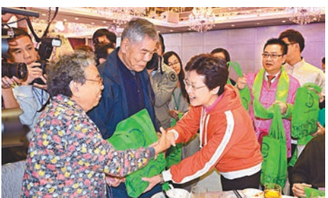
2014年春，林鄭月娥（前排右一）在活動上向長者派送新春福袋。