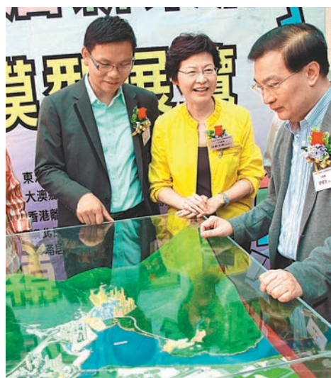
2012年中，時任發展局局長的林鄭月娥（中）巡視東涌公屋規劃。

現屆政府也推出多項措施規劃長遠土地供應，包括推展多個新發展區，以及研究大嶼山發展和興建東大嶼都會的可能性。上述種種政策都講求延續性。 曾任發展局局長的林鄭月娥在房屋措施上當然亦有其願景。她早前講述其「八大願景」時，亦坦承土地的樽頸是一個很大的挑戰，並提出「平衡發展、優化城市」，希望藉着早前公佈的「香港2030+」，能夠凝聚到社會的共識，如改造發展稠密的市區，並在新發展區採用適切的發展密度；以鐵路運輸為骨幹，輔以