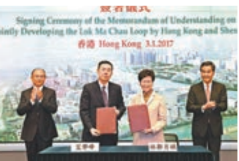
本月初，林鄭月娥代表港府與深圳簽訂河套合作備忘錄。資料圖片

設經貿辦、參與亞投行的籌建工作等。 港深同城 前海河套典範 同時，林鄭月娥在任政務司司長期間，亦做了不少兩地協作工作，包括上任政務司司長兩周，就前往深圳出席「深圳前海深港現代服務業合作區政策宣講暨招商推介會」，強調如何充分利用粵港「兩個市場、兩種機制」的優勢，加快實現香港服務業與內地市場的對接，鞏固提升香港作為國際金融中心的地位。 她並在深港合作會議，簽署了多項協議，涵蓋發展前海、兩地青年交流及創新創業、旅遊、文化等範疇，甚至着手解決雙非兒童跨境就學問題。最近一次的深港合作會議，更由林鄭月娥與深圳市副市長文學峰簽署合作備忘錄，同意共同將落馬洲河套區發展成創新及科技園區，建立重點創科研究合作基地。