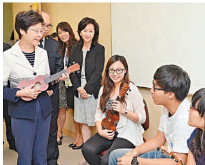
2015年中，林鄭月娥（左一）到訪黃大仙區與參加音樂班的青年交談。

過往談到青少年發展，不少人都將目光移至大學學額之上。現屆政府總算打破這種思維，提倡多元出路，鼓勵年輕人進行生涯規劃，每位青年人都可以找到自己的出路。林鄭月娥認同，需延續培育青年多元發展的思維。同時，任職政務司司長期間擔任人口政策督導委員會主席的她，亦指出香港人口結構將快速老齡化的狀況，並提出要以更放開、包容的態度去廣納海內外的人才，強化香港即將萎縮的勞動力。 香港社會強調「唯有讀書高」，但忽略了體藝或其他方面的專才。現屆政府倡儀為青年人提供多元出路，在專業教育以外，亦宣傳職業教育，讓不同志趣的青年人可以擇其所愛。在教育政策方面，政府大力推動學校及不同機構協助青年人進行生涯規劃，包括自2014/15學年起，為全港中學提供每年50萬元津貼，以加強推行生涯規劃教育，幫助青年人找到屬於自己的出路。