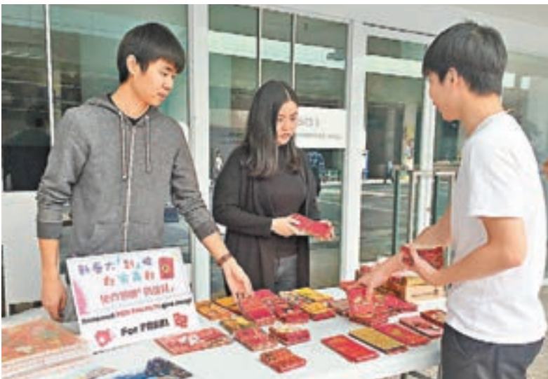
浸大校園李作權大道和方樹泉圖書館外擺放攤位,供師生捐贈或領取年曆和利是封。

同時,他們與環保署認可的回收承辦商合作,把回收得來仍可正常操作的電器捐予有需要的人,壞掉的則可拆件回收;罐頭食品捐予食物銀行。他們計劃農曆新年後回收賀年食品。記者 黎恣