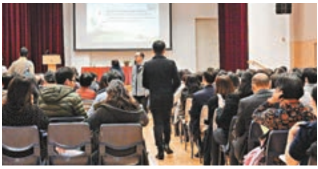
教育局舉行首場更新《中學教育課程指引》簡介會。

香港文匯報訊(記者 溫仲綺)教育局正就《中學教育課程指引》作出修訂,昨日舉行首場簡介會,向學界介紹指引的更新部分。據現場派發的暫定稿顯示,當局擬在初中的3年間,讓學生於生活與社會、中國歷史兩科,修讀共39小時的基本法教育;連帶非必修的歷史、地理科亦會撥出課時教授基本法,故整體的教學時數將逾50小時。學界對未來課程發展方向感到樂觀,亦有校長指未來要按校本研究如何深入淺出推動基本法教育,令學生學得更有效。