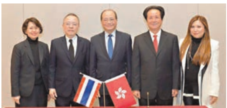
教育局與泰國教育部昨日簽署教育合作諒解備忘錄,吳克儉表示高興。

香港文匯報訊(記者 姜嘉軒)教育局昨日宣佈與泰國教育部簽署教育合作諒解備忘錄,加強兩地教育協作。局長吳克儉表示,備忘錄標誌着香港與泰國在教育領域開展更緊密合作的新里程,兩地日後將有更具體的教育合作,為港生提供更多學習和發展機會。