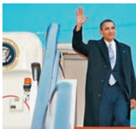
■ 奧巴馬任內多次外訪。圖為他乘坐空軍一號。

美俄關係是奧巴馬任內的外交主調之一，他上任之初，提倡對俄羅斯實現「重啟」，但從烏克蘭危機、敘利亞問題以至近期的俄黑客干預大選疑雲，奧巴馬和俄總統普京的關係愈趨惡化，不僅顯示兩國關係「重啟」落空，在與普京的交手當中，奧巴馬更是難佔上風。