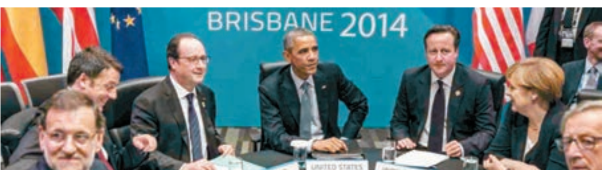
■ 奧巴馬任內極力爭取外交政績。圖為他出席2014年澳洲G20峰會。

敘利亞及伊拉克是無人機任務的主要目標，其他還有阿富汗、利比亞、也門、索馬里及巴基斯坦。美國的無人機造成多少無辜生靈塗炭，相信沒有人能計算清楚。華府去年發表報告指無人機於2009至2015年間，在巴基斯坦和也門等地造成最多116名平民死亡，但傳媒及民權組織批評當局大為低估死亡人數。