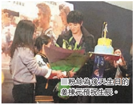
■粉絲為後天生日的姜棟元預祝生辰。

香港文匯報訊(記者 陳敏娜)韓國人氣男星姜棟元和金字彬偕同導演曹誼錫來港宣傳新片《MASTER》，前晚三人現身戲院，舉行最後一場謝票活動。他們都表示很開心跟港迷見面，姜棟元希望今後可繼續拍多些作品跟大家見面，金字彬想再來港外，還用廣東話說：「真係多謝。」杯粉絲。其間，他們送出簽名海報，曹導演專程選了從菲律賓來的粉絲，而金字彬亦非常識做，大方送抱。他們跟粉絲影大合照和握手後就準備離場，突然現場響起生日歌，原來是為了幫本月18日生日的姜棟元預祝生辰，他見到粉絲送上生日蛋糕非常驚訝，與粉絲合影和抱抱後才離去。原定昨日才離開的金字彬結束活動後，已搭機返韓。