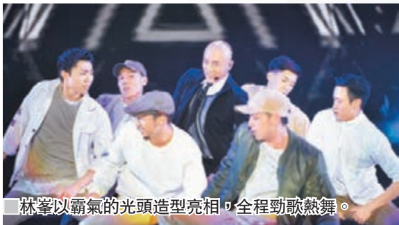
■林峯以霸氣的頭光造型亮相，全程勁歌熱舞。