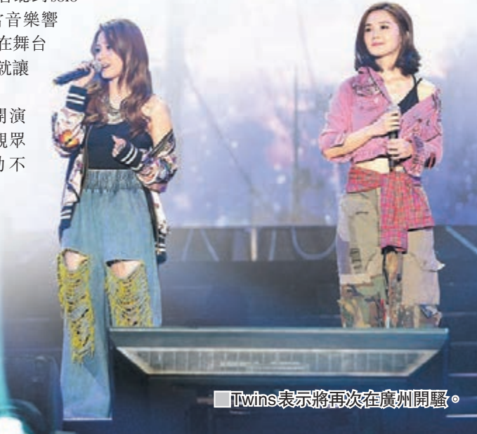
■Twins表示將再次在廣州開騷。