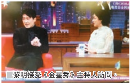
■黎明接受《金星秀》主持人訪問。

香港文匯報訊 黎明日前接受內地訪談節目《金星秀》時，節目主持人問到：「還會付出愛情嗎？」黎明很爽快答：「會會會，要不是就出家做和尚了，一定付出，因為愛情就是這樣，你不可能不付出的，因為你不付出，人家也不會付出。你要付出了才知道，最後人家願不願意繼續付出。」講到就算將來搵伴侶，黎明一定唔會揀西方人，佢話：「我很相信緣分，緣分來到，就要好好珍惜，別西方人了吧！西方人太喜歡離婚了！」