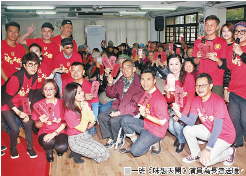
一班《味想天開》演員為長者送暖。