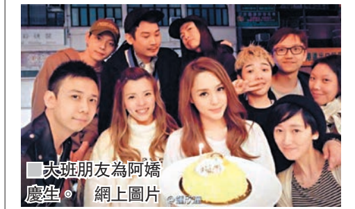
尖班朋友為阿嬌慶生。

傳王菲霆鋒香港築愛巢 香港文匯報訊剛在上海開完演唱會的女王，昨日被爆除了在北京與謝霆鋒築愛巢外，原來他倆早在2013年就斥資一億元購買深灣一個中層單位，以及荃灣皇璧高層A座複式豪宅，荃灣皇璧更是面積3千幾呎的單位，跟好友趙薇做鄰居。正因如此，王菲返回皇璧時，別人也以她住在趙薇家，成功掩人耳目。