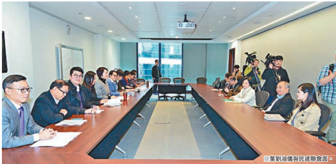
葉劉淑儀與民建聯會面。

香港文匯報訊（記者 羅旦）新一屆特首選舉將於3月舉行，已表明會參選的新民主黨主席葉劉淑儀昨日與民建聯黨團及立法會議員會面。民建聯主席李慧琼會後表示，民建聯現階段未有決定提名取向。