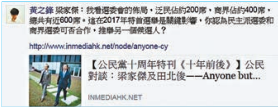
黃之鋒翻梁家傑舊賬。