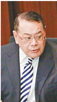
■石禮謙 彭子文 攝

房屋署署長應耀康承認，要為沒有撰寫會議記錄負責，但解釋並非刻意不記錄，只因太投入工作所致，又形容該7次會議都是「救火」會議，很多事情不能等到有會議記錄才跟進，例如安排水車供水都要在會議即日行動，直到第八次會議才醒覺將來或有人希望進一步了解事件，因此其後跨部門會議都有記錄。他指整理文件需時，會按議員要求再處理這七次會議的記錄。