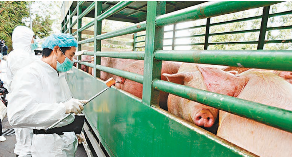
■議員參觀收集活豬尿液樣本過程示範。