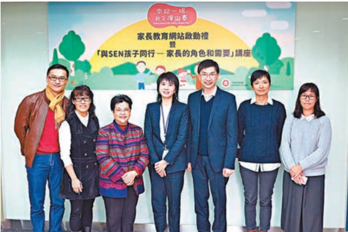
■社聯與扶貧委員會合作推出SEN孩童一站式服務網站。

她又引述，有母親知道孩子是SEN兒童後，數日數夜無法入眠，在網上搜集資訊，自製特殊育兒計劃，令人感動。她相信，新網站將對SEN家庭提供及時有效的幫助，令數以萬計的SEN兒童得到恰當培育。