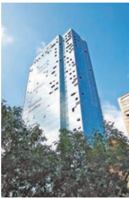
由於觀塘漸多新式工廈,加上政府銳意將東九發展成另一個CBD,吸引不少大企業落戶。圖為觀塘皇廷廣場。

看好舊式工廈投資前景。他指出,新式工廈的競爭對手主要為甲級尾或乙級的商廈,若兩者價錢相差不遠,市場仍傾向選擇商廈,而新式工廈的回報率,一般亦不如入場門檻較低的舊式工廈。