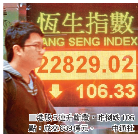
港股5連升斷續,昨倒跌106點,成交639億元。

香港文匯報訊(記者 周紹基)港股5連升斷續,在高開22點逼近23,000點時,遇上了獲利盤出貨,恒指結果要倒跌106點報22,829點,成交639億元。「股王」騰訊(0700)連升多日,終於要回氣,股價一度大跌2%,收市縮窄至1%,令大市跌幅大減。其餘大藍籌如友邦(1299)、中移動(0941)及建行(0939)等,全數先升後回,都令大市倒跌的原因。