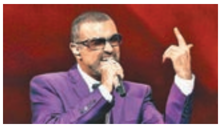
佐治米高曾在廣州開個唱。