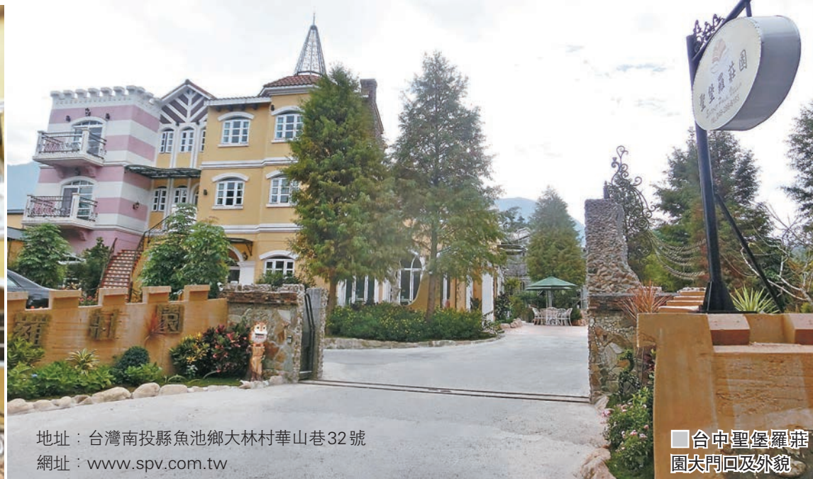
地址：台灣南投縣魚池鄉大林村華山巷32號 網址：www.spv.com.tw