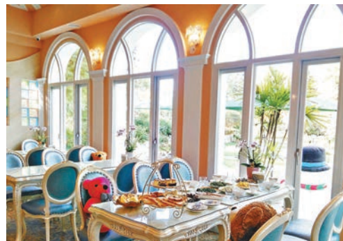
■ 餐廳設計非常舒適