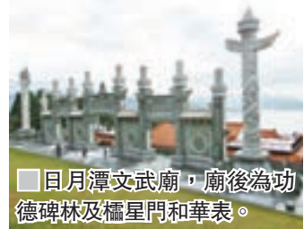
■ 日月潭文武廟，廟後為功德碑林及櫺星門和華表。