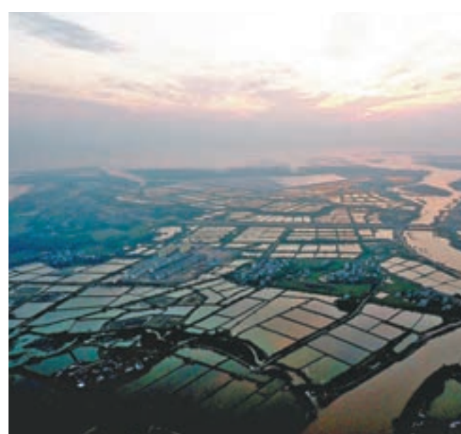
蝦塘「水墨」繪出海灣田園美景 ■ 日落時分的欽州灣蝦塘景觀