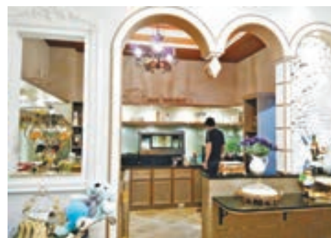
■ 莊園廚房由男主人掌舵