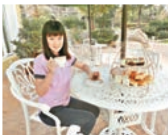
■ 在莊園的莫內花園歛下午茶

日月潭文武廟之正門「三川牌樓」，採用牌樓式構築，形態高聳挺拔。關有三個出入口，中央較高，兩側略低，如「山」字形，故稱「山門」。主體建築採「一埕二庭三殿」，是以「三進三殿，兩廂兩廊」的格局興建，依序為牌樓、廟埕、拜殿及水雲宮、武聖殿、大成殿。廟後為功德碑林及櫺星門和華表，還有後山花園，其上有一座八角涼亭。文武廟除了祭孔、祭關、祭岳及祭眾神祈求保佑等弘道事務外，也舉辦公益活動，例如以教育講習、慈善藝文活動，用意在對社會作出貢獻。