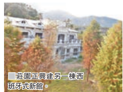
■ 莊園正興建另一棟西班牙新館。

女主人溫太太透露，夫婦從事貿易生意一段日子，賺到錢，丈夫卻身體出了毛病，腸敏感及輕微中風，女主人決定稍為放慢腳步，用賺到的錢回台灣買地，建夢想莊園，建好後開業不足一年，丈夫的腸敏感已經完全消失，令她更覺得當初的決定是對的。目前他們還有一棟西班牙別墅興建中。