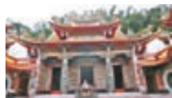
■ 日月潭旁邊的龍鳳宮

想求姻緣的男性，則要從月老左手拉紅線，女性要從右手拉紅線，千萬別拉錯線，可是會拉錯姻緣喔！月老廟解籤人員表示，「月老的左手，紅線代表在左手邊，代表是男生的線，在右手的代表是女生的線，那男生跟女生的線一定要分開拉，拉錯線姻緣就會拉錯了。若要求紅線的話，一樣要先擲筊，詢問是否可以賜紅線，得到允許的話就從繡球上抽一條當紅線，成功找到你的另一半時，紅線不可以隨便丟掉或是化掉，這樣你的姻緣也會隨之消失不見，當得到好姻緣後，記得要回去還個願。農曆新年就快到，大家不妨也去求個姻緣，祝願新年愛情得意。