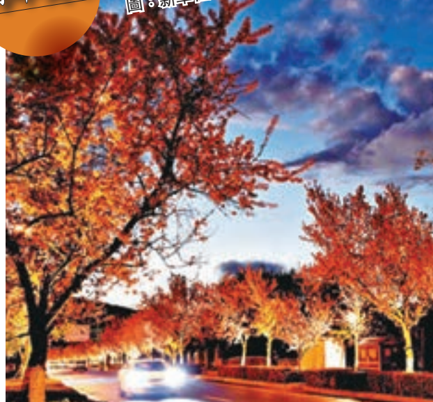
夜光中的冬櫻花 ■ 昆明紅塔西路上綻放的冬櫻花