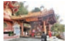
■ 據說月老廟超靈驗