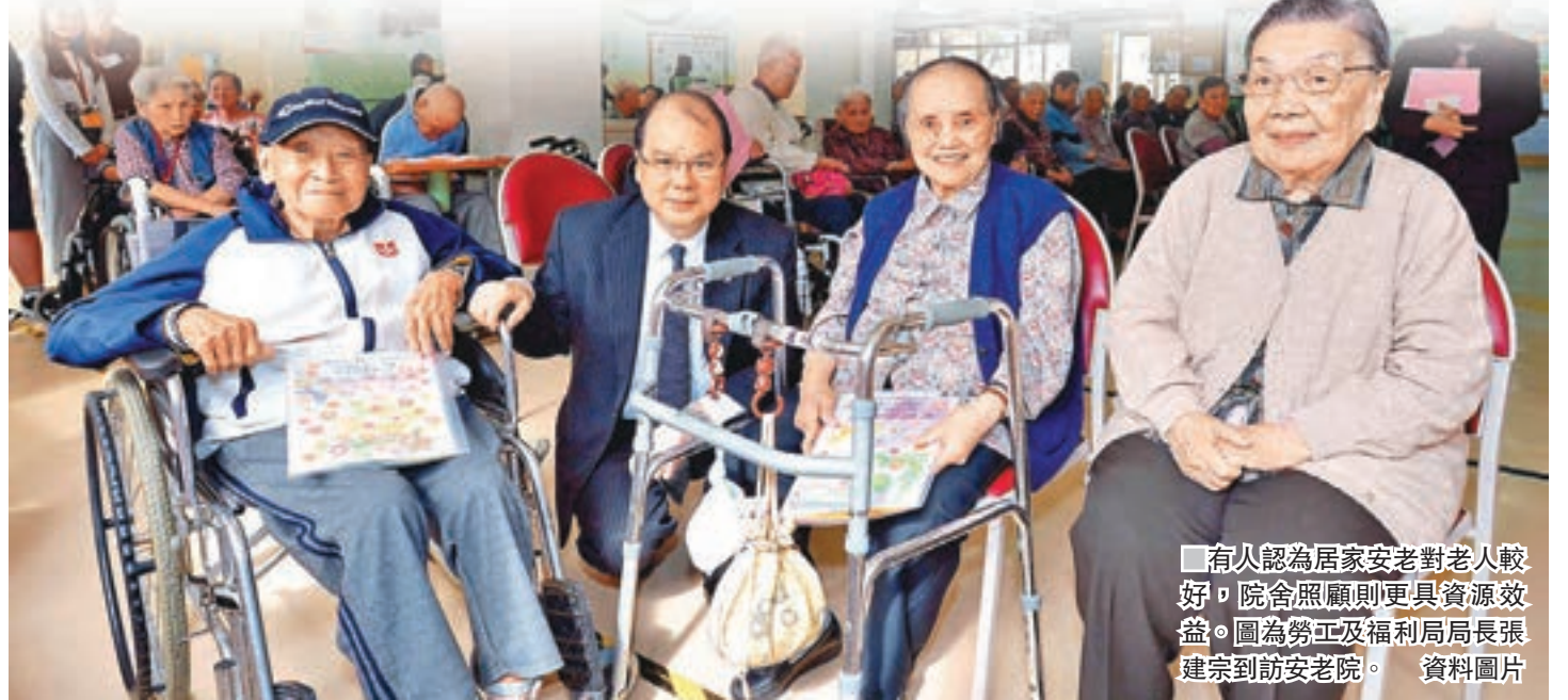
有人認為居家安老對老人較好，院舍照顧則更具資源效益。圖為勞工及福利局局長張建宗到訪安老院。