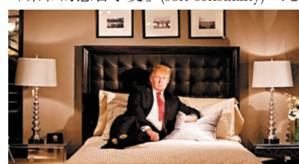
網民翻出特朗普舊照。

美國候任總統特朗普就職典禮委員會主席席巴拉克前日表示，這場就職禮將是「柔和的感官享受」(soft sensuality)。此言一出，網民紛紛質疑，而「#softsensuality」標籤在twitter迅速爆紅，網民不斷上載惡搞圖片調侃，包括特朗普年輕時穿睡袍倚在床上的舊照。