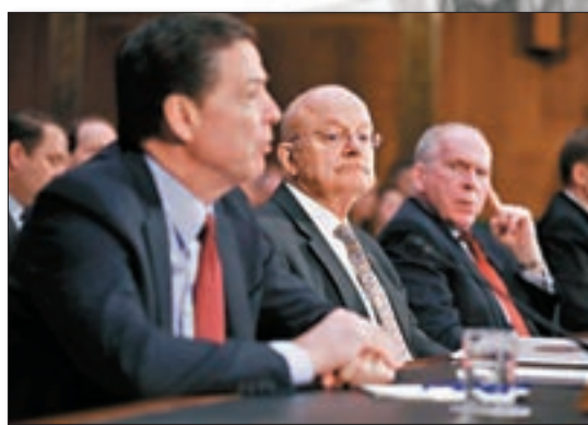
FBI局長高銘(左)在參議院聽證會作供。