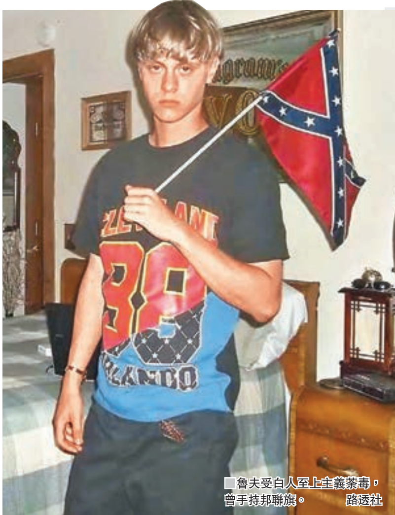
魯夫受白人至上主義荼毒，曾手持邦聯旗。