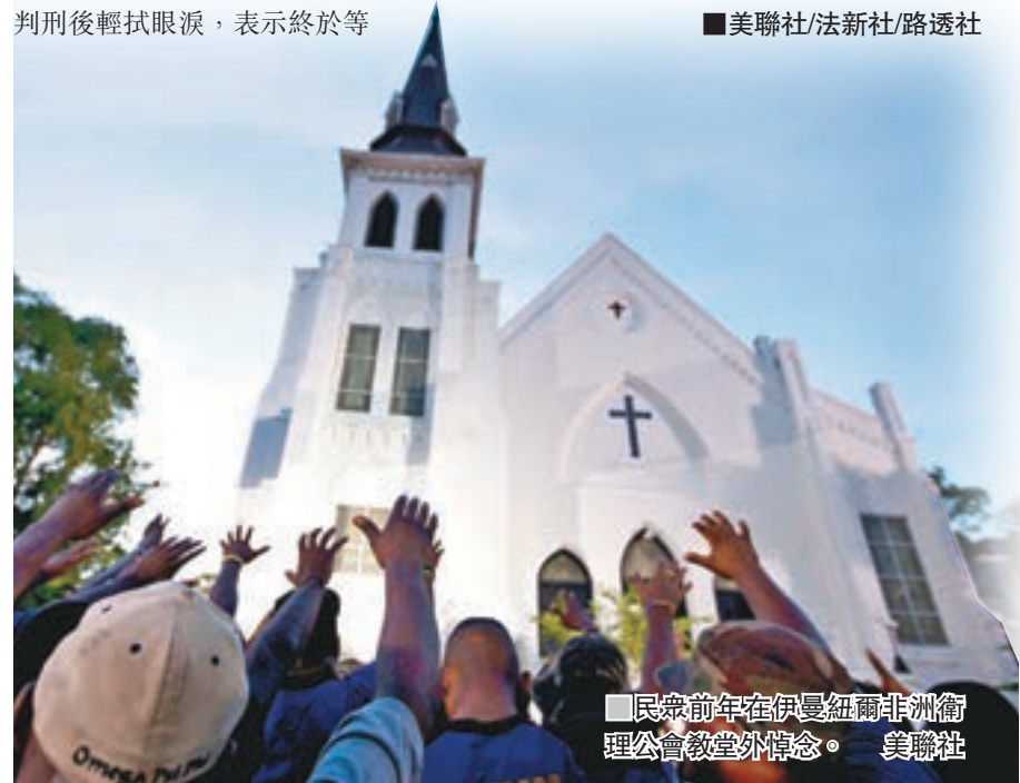
民眾前年在伊曼紐爾非洲衛理公會教堂外悼念。