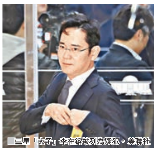
三星「太子」李在鎔被列為疑犯。