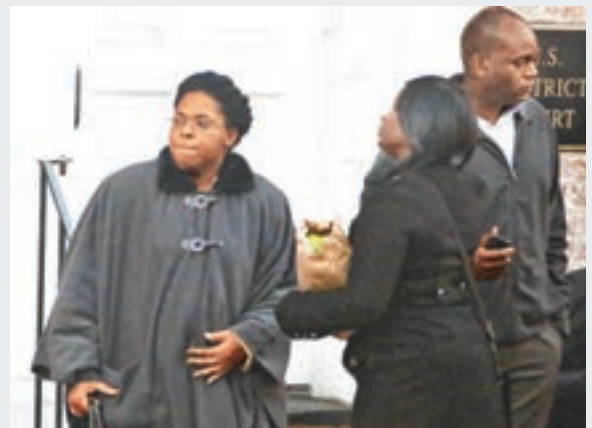
槍擊案遇難者親屬到庭旁聽。美聯社