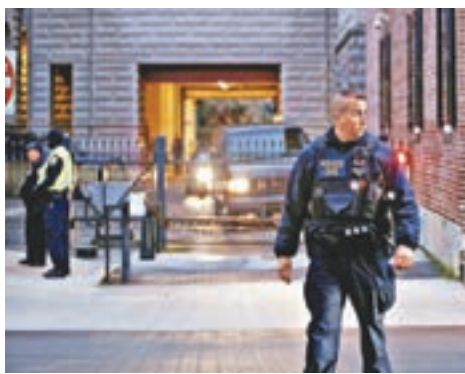
魯夫出庭，當局部署警力戒備。