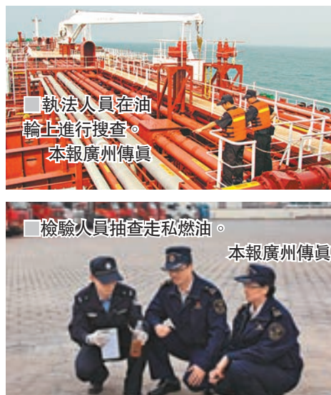
執法人員在油輪上進行搜查。