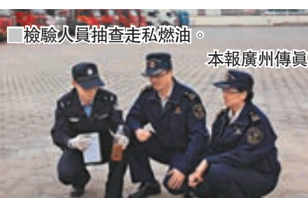
檢驗人員抽查走私燃油。