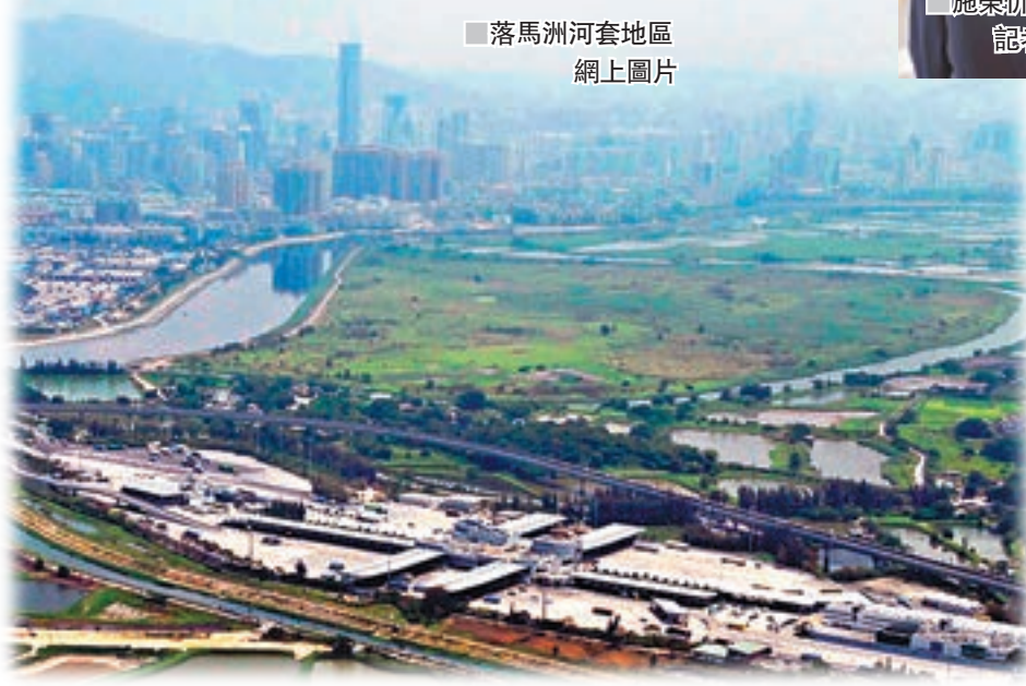
落馬洲河套地區 網上圖片

香港文匯報訊（記者 李望賢、李昌鴻 深圳報道）深港兩地將在河套地區共同發展「港深創新及科技園」，引起各界高度關注。昨日召開的深圳市政協六屆三次會議上，多名港澳委員聚焦河套地區建設。他們表示，希望深港兩地盡快推進項目落實，成立相應委員會探討短中長期規劃等，並對接深圳和東莞創新科技產業鏈，吸引優秀人才打造成「中國硅谷」。