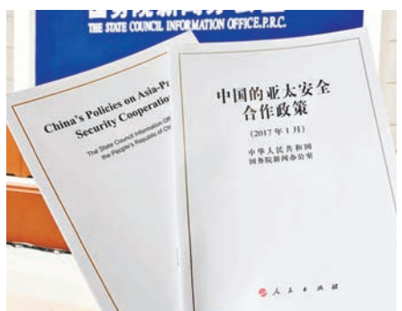
《中國的亞太安全合作政策》白皮書的中文版和英文版。