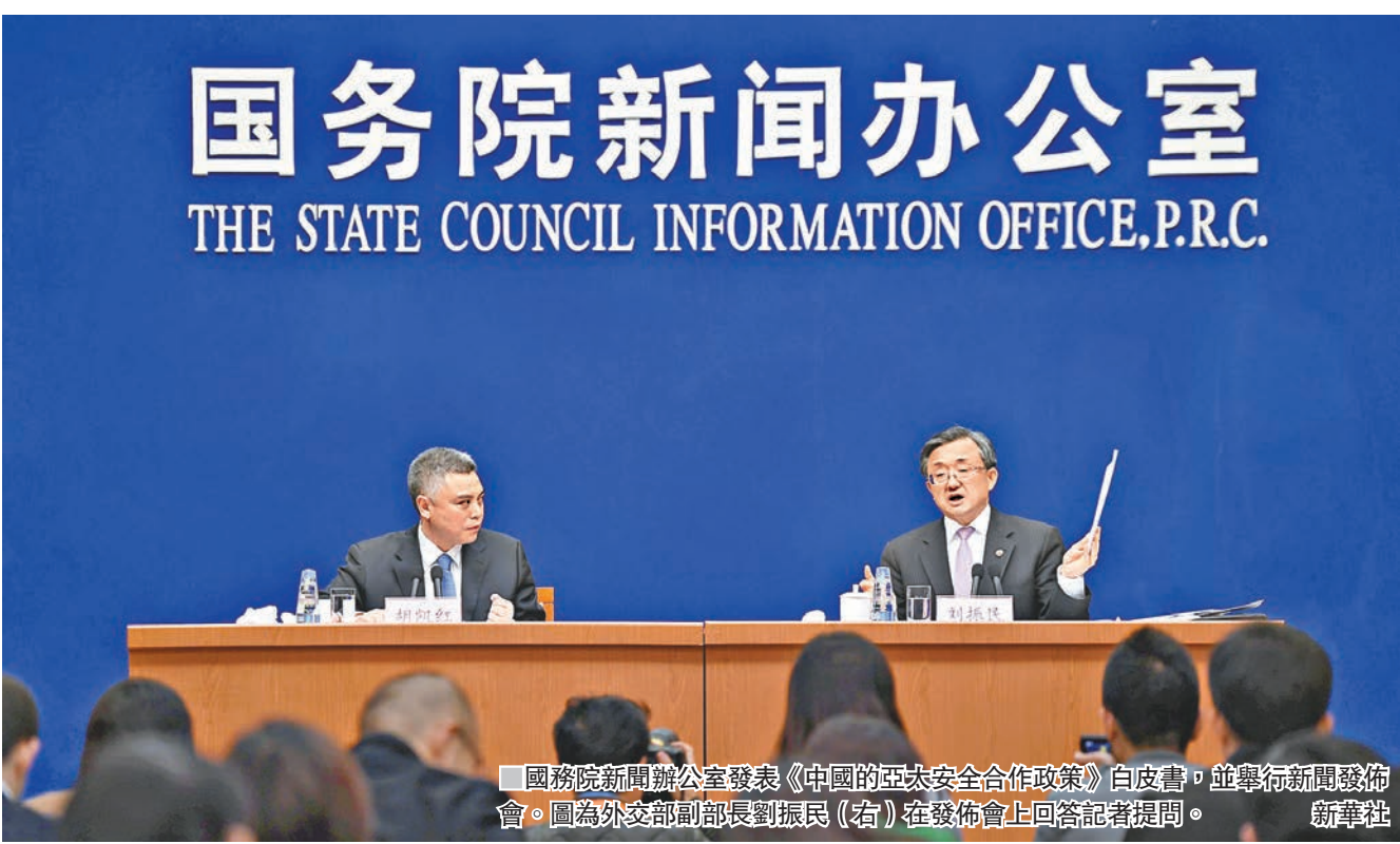
國務院新聞辦公室發表《中國的亞太安全合作政策》白皮書，並舉行新聞發佈會。圖為外交部副部長劉振民（右）在發佈會上回答記者提問。

香港文匯報訊（記者 馬靜 北京報導）國務院新聞辦公室昨日發表《中國的亞太安全合作政策》白皮書，這是中國政府首次就亞太安全合作政策發表白皮書，白皮書在地區熱點問題部分將海上問題單獨列出，並表示要爭取早日達成「南海行為準則」。外交部副部長劉振民在昨日發佈會上透露，「南海行為準則」磋商進入非常重要的階段，力爭在上半年完成「準則」框架草案。內地學者認為，南海問題未來「變量」潛在於個別域外大國由隱性介入轉為公開介入，這將會讓南海局勢走向複雜化和擴大化，「這也是當前我們的主要擔憂以及我們和其他相關國家需要防範的內容。」