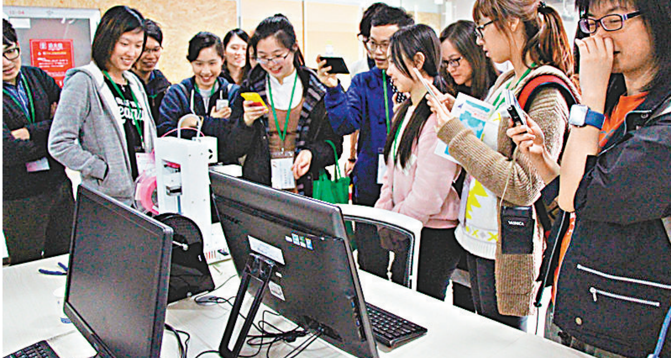
賽格創客中心新奇的創業項目引來眾多香港學生參觀。 資料圖片