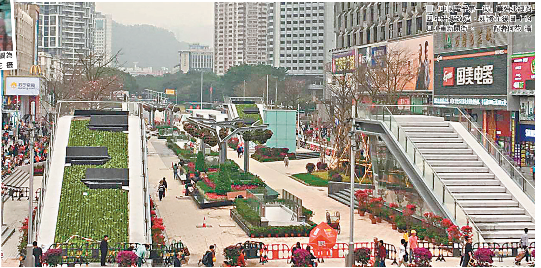
「中國電子第一街」華強北經過四年升級改造,即將在後日(14日)重新開街。