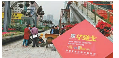
工人們昨日仍為開街進行收尾工作。

香港文匯報訊(記者 何花 深圳報道)「中國電子第一街」華強北經過四年升級改造,即將在後日(14日)拆除所有圍擋,重新開街。經歷了轉型陣痛,華強北正從港人記憶中的「山寨王國」向「國際電子商業名城」和「創客搖籃」轉變。從無人機、機械人、智能平衡車到智能穿戴手錶等,智能硬件在華強北應有盡有。一位海外歸國的創業者曾說:「只要是做智能硬件,你就繞不開深圳華強北。這裡是科技天堂,有各種各樣的可能、機遇和創造的空間。」