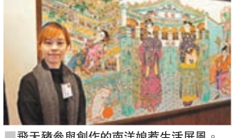
飛天豬參與創作的南洋娘惹生活屏風。