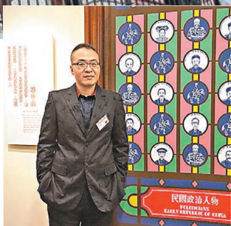
石家豪創作一組四件的民國人物系列。

雖是言明要將歷史藝術相結合，但他並不會將鮮明的歷史含義植入作品中，他表示：「國外很多大型的博物館，如大英博物館等既可以说它是歷史博物館，也可以說它是藝術館，展品既是文物又是藝術品。但在香港，歷史館和藝術館的概念分明，我便萌生了將二者結合的想法。所以這次創作我會先收集孫中山的歷史資料，根據他的足跡線索創作，希望觀眾也可以跳出文字史料的限制，通過這些圖畫輕易記得孫中山到過的7個地方，這也是我的目的之一。」