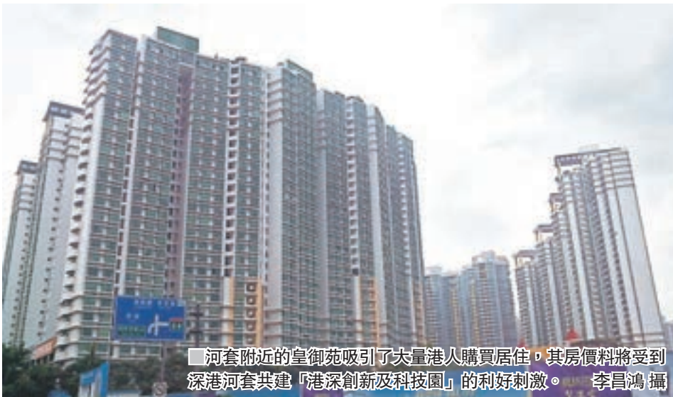
河套附近的皇御苑吸引了大量港人購買居住,其房價料將受到深港河套共建「港深創新及科技園」的利好刺激。

由於落馬洲河套地區處於深圳與香港的樞紐地帶,皇崗口岸是深圳前往香港的熱點關口,交通便捷性極強,吸引了不少香港同胞