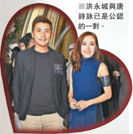
洪永城與唐詩詠已是公認的一對。