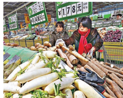
國家統計局指出，氣溫偏高致鮮菜和鮮果價格漲幅走弱。圖為山西太原民眾在超市挑選蔬菜。

香港文匯報訊（記者海巖 北京報導）國家統計局昨日公佈數據顯示，受鮮菜價格漲幅回落等影響，2016年12月居民消費價格指數（CPI）同比上漲2.1%，全年CPI同比上漲2.0%，完成了全年3%左右的物價調控目標。經濟學家預計，今年CPI將繼續小幅上漲，全年平均水平預計在2.5%左右，年中或達到單月通脹高點，個別月份漲幅可能突破3%。