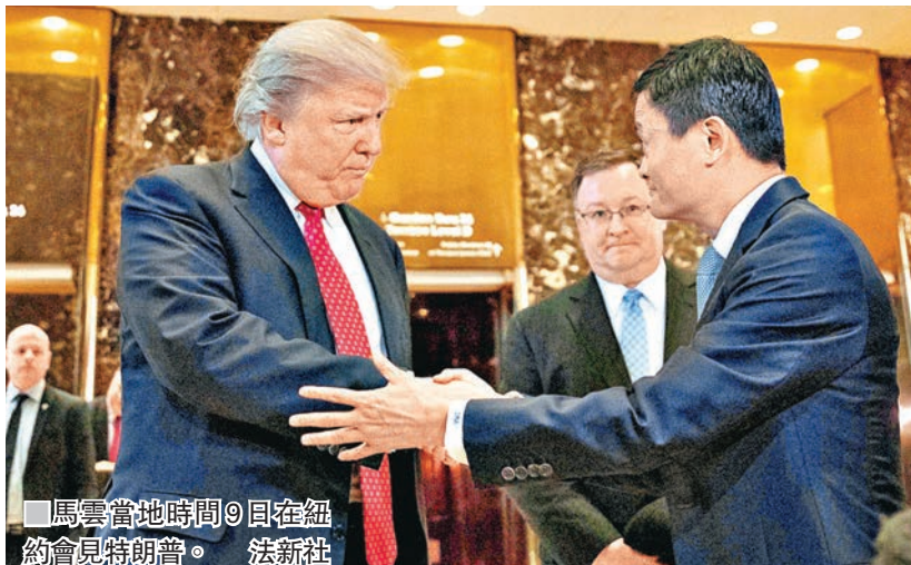
馬雲當地時間9日在紐約會見特朗普。

香港文匯報訊 據新華社報道，阿里巴巴集團董事局主席馬雲當地時間9日在紐約會見美國當選總統特朗普後表示，阿里巴巴將幫助100萬美國小企業將其產品銷往中國和其他亞洲市場。馬雲當天在特朗普大廈與特朗普會談後告訴媒體，他們重點討論了如何幫助100萬美國小企業，特別是位於美國中西部的小企業，通過阿里巴巴的平台向中國和其他亞洲市場銷售美國農產品和服務。馬雲表示，他認為商界溝通有助於中美更好地了解彼此政治環境，中美關係應「加強」和「更為友好」。特朗普也表示雙方會談友好，稱讚馬雲是出色的企業家，雙方會一起做「偉大的事情」。