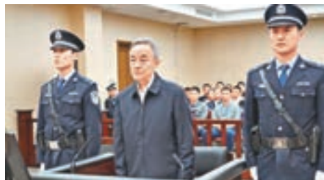
奚曉明當庭認罪悔罪。

香港文匯報訊 據央視報道，天津市第二中級人民法院昨日一審公開開庭審理了最高人民法院原副院長奚曉明受賄一案。控方指稱奚曉明於1996年至2015年間，利用職務便利，直接或通過家人非法收受1.14億元人民幣，奚曉明當庭表示認罪悔罪。法庭將擇期宣判。