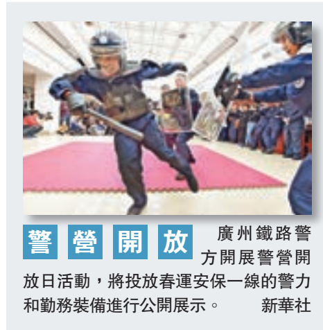
警營開放 廣州鐵路警方開展警營開放日活動，將投放春運安保一線的警力和勤務裝備進行公開展示。 新華社

國家統計局昨日發佈數據顯示，在去產能等多重因素影響下，2016年12月工業品出廠價格指數（PPI）同比上漲5.5%，比前一月擴大了2.2個百分點，大幅超出4.6%的市場預期水平，創5年多新高。經濟學家表示，去年最後幾月PPI超預期回升有助於改善企業經營，同樣預示經濟回升可能超預期。今年一季度PPI有望繼續加快上升達到全年高點，全年PPI有望實現近6年來首次轉正。