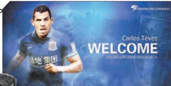
■泰維斯以兩年7500萬歐元薪金加盟申花。