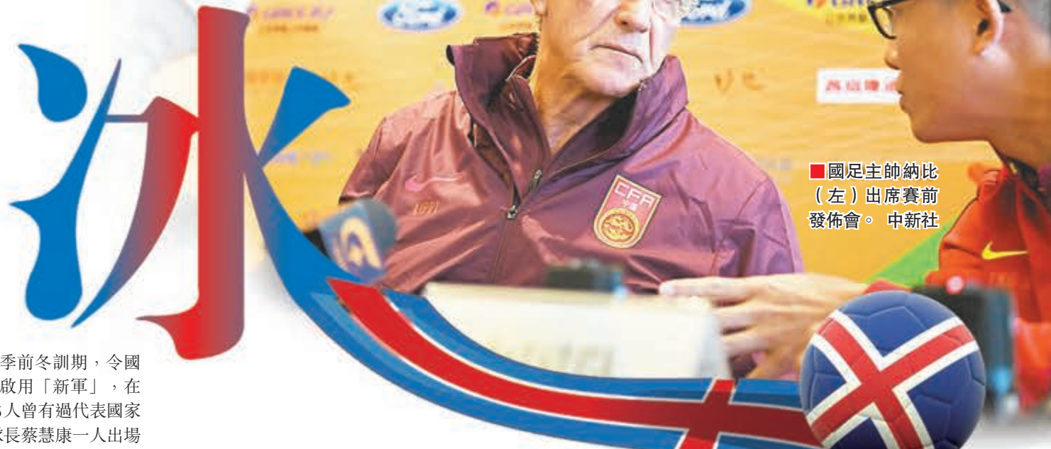
■國足主帥納比(左)出席賽前發佈會。

由於各中超列強正處季前冬訓期,令國足主帥納比不得不啟用「新軍」,在入選的23名球員中只有6人曾有過代表國家隊出戰的紀錄,其中僅隊長蔡慧康一人出場次數達兩位數。