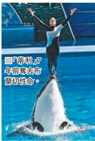
「蒂利」7年前奪去布蘭切性命。