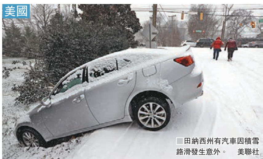
田納西州有汽車因積雪路滑發生意外。

美國廣泛地區及歐洲多國近日分別遭受暴風雪侵襲，造成至少11人死亡。美國發佈的冬季風暴警告影響多達6,000萬人，北卡羅來納州、亞拉巴馬州及佐治亞州宣佈緊急狀態。前日的北卡州新任州長就職儀式改室內舉行，原定昨在戶外舉行的大型儀式及巡遊被迫取消。