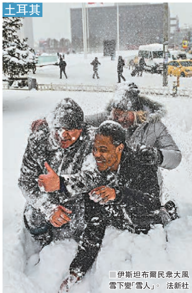
伊斯坦布爾民眾大風雪下變「雪人」。

美國南部遭猛烈冬季風暴吹襲，氣象部門向得州至弗吉尼亞州廣泛地區發出監測警報，預計北卡州及弗吉尼亞州部分地區將出現30厘米大雪，導致交通癱瘓。愛達荷州首府博伊西周四降雪38厘米，打破1980年代中期創下的33厘米紀錄。肯塔基州一名電單車司機因路面積雪，導致轉彎時失控割出路面身亡。亞