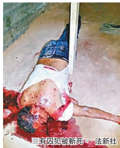
有囚犯被斬死。