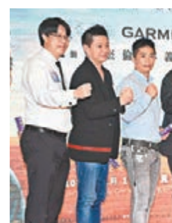
周杰倫(左四)表示家人會來港觀看其演唱會。

香港文匯報訊(記者李思穎)全新勵志片《一萬公里的約定》昨晚在香港舉行首映活動，片中演員賴雅妍、黃遠聯同導演洪昇揚、身為超級馬拉松選手的監製林義傑出席；在首映禮開始前於銅鑼灣舉行記者會。而另一監製周杰倫更專程從台灣來港撐首映場，本來片中男、女主角聯同導演「齊人」現身，已吸引不少粉絲圍觀，「周董」甫出場立即即來哄動，他亦友善揮手同大家打招呼。