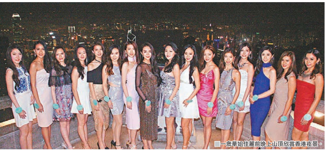
一眾華姐佳麗前晚晚上山頂欣賞香港夜景。