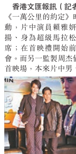
賴雅妍(左)和黃遠在片共譜姊弟戀。