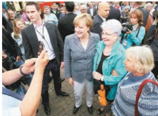
■德國今年舉行大選，但對外交關注不足。圖為默克爾拉票。