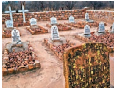
■納米比亞10萬原住民遭屠殺。網上圖片

面對原住民起義，德軍選擇強硬應對，將數以萬計赫雷羅族人送到了沙漠，在他們的井水下毒，實行斷水斷糧。馮特羅塔又實施格殺令，下令殺死「任何赫雷羅族人，不論他們有沒有槍或牲畜。婦孺同樣不