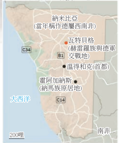
主要大屠殺發生地點

根據紐約曼哈頓地區法院收到的入稟狀，原告是代表全球赫雷羅族及納馬族人的人士，向因為德國殖民政府屠殺而受苦的族人，尋求賠償，但未有透露實際金額。此外，他們又希望確保在目前正進行的德國與納米比亞政府之間、就當然大屠殺的談判，在達成任何協議前需先得到他們的同意，赫雷羅族及納馬族人後裔亦必須是協議簽署方之一。