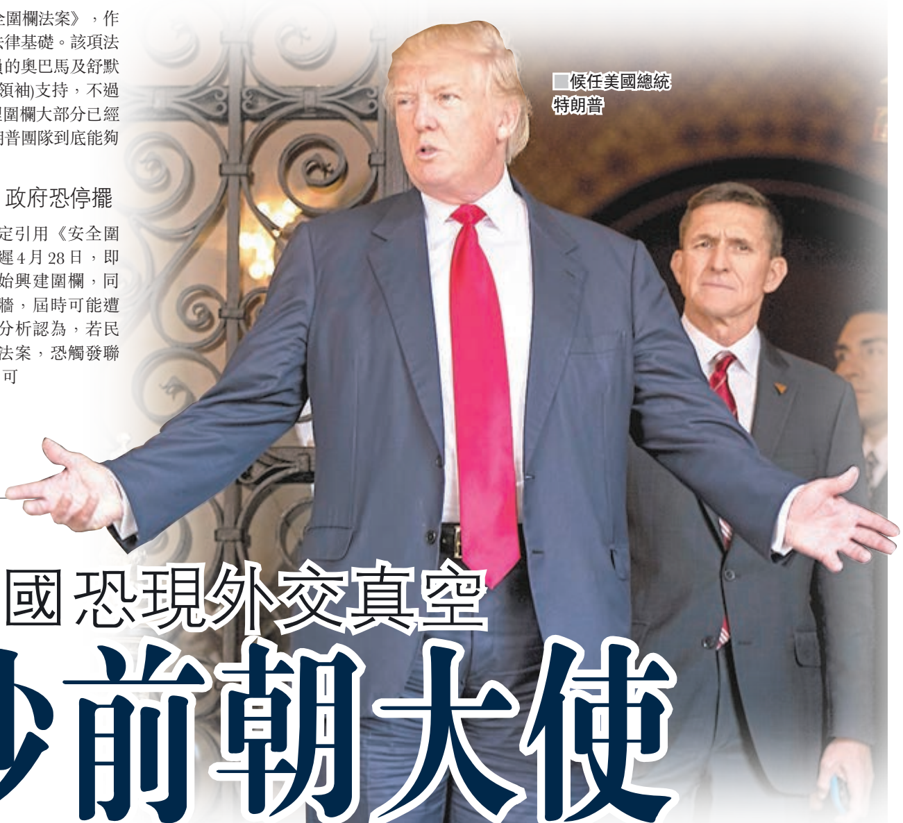
候任美國總統 特朗普

錢。特朗普沒有否認打算向國會伸手要錢興建圍牆，但聲稱這只是為了加快進度的權宜之計，並重申墨西哥「之後要還錢」。特朗普團隊發言人接受訪問時，亦否認由美國先行墊支是違反競選承諾，又指特朗普會繼續與墨西哥方面談判。不過墨西哥政府已多次表明，絕不會為圍牆支付一分一毫。據報特朗普過渡團隊希望利用