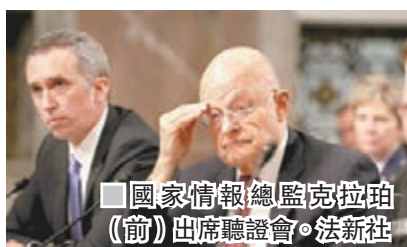
國家情報總監克拉珀(前)出席聽證會。

俄羅斯被指透過黑客干預美國大選一事有新進展，美國最新情報調查報告顯示，中央情報局(CIA)確認俄國黑客在總統普京指示下，盜取美國民主黨全國委員會(DNC)及民主黨高層的電郵，再經第3方轉交洩密網站「維基解密」，目的是協助共和黨候選人特朗普勝出大選。報告又透露，CIA已鎖定參與黑客活動的俄國高官身份，並指他們在特朗普勝出後曾經慶祝。