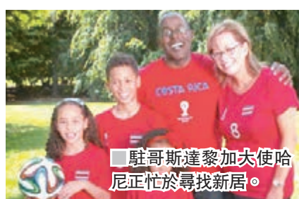
駐哥斯達黎加大使哈尼正忙於尋找新居。