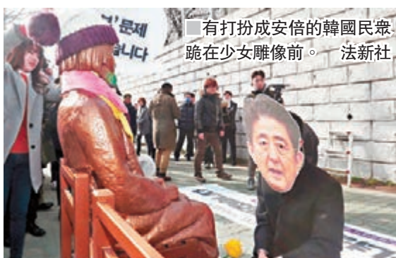
有打扮成安倍的韓國民眾跪在少女雕像前。

韓國民間組織上周在日本駐韓國釜山總領事館前，設置象徵受害慰安婦的少女雕像，日本昨日決定臨時召回駐韓大使長嶺安政和駐釜山總領事森本康敬抗議，並指責韓國沒有誠意履行日韓關於慰安婦問題的協議。