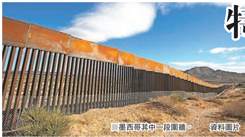
墨西哥其中一段圍牆。資料圖片

2006年通過的《安全圍欄法案》，作為興建邊境圍牆的法律基礎。該項法案當年獲時任參議員的奧巴馬及舒默(現任參議院少數黨領袖)支持，不過法案中適用的700哩圍欄大部分已經興建，暫時未知特朗普團隊到底能夠從中確保多少資金。