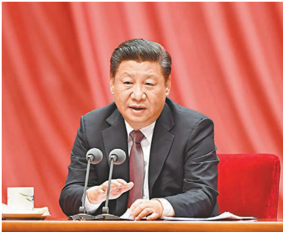
■ 習近平在十八屆中央紀委七次全會上發表重要講話。

習近平強調，黨的高級幹部要做嚴肅黨內政治生活的表率，始終把握正確政治方向，堅持政治立場和政治原則，遵守政治