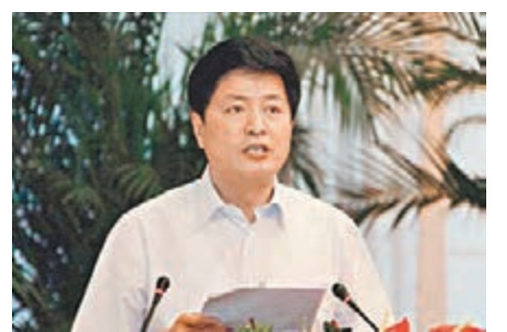
■ 王茂設 本報徐州傳真

香港文匯報訊 (記者 楊奇霖 徐州報道) 山西運城原書記王茂設受賄案昨在江蘇省徐州市中級人民法院公開宣判，王茂設單獨或共同受賄金額達5,200餘萬元(人民幣，下同)，被判處有期徒刑15年，並處沒收個人財產500萬元。王茂設受賄所得財物及其孳息予以追繳，上繳國庫。