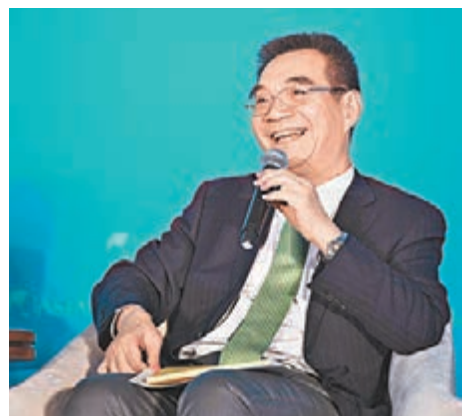
■ 林毅夫認為，未來中美雙方可以攜起手來，在全球範圍內進行基建項目合作。 資料圖片

耿爽表示，中方願與美國現任和下一屆政府一道，秉持不衝突不對抗、相互尊重、合作共贏原則，拓展合作，管控分歧，推動兩國關係在新的起點上不斷取得進展，造福兩國和其他各國人民。