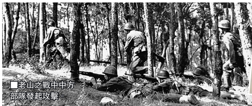
老山之戰中中方部隊發起攻擊。