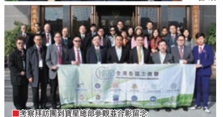
考察拜訪團到寶星總部參觀並合影留念