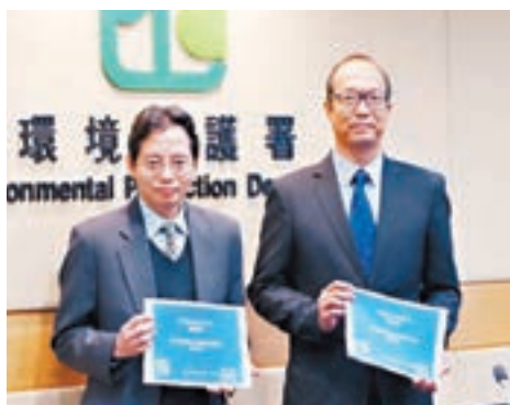
環保署表示,整體空氣質素有改善。

香港文匯報訊(記者 何寶儀)空氣質素的好壞對人體健康有直接影響,環保署昨日回顧本港去年空氣質素,13個一般監察站錄得空氣質素健康指數(AQHI)達7(健康風險水平為高)或以上總時數,共錄得322天合共1,535小時,分別按年跌44%及58%。路邊監察站分別錄得61%及75%減幅,以中環、銅鑼灣及大埔區改善最顯著,均較前年跌近80%,反映整體空氣質素有改善。