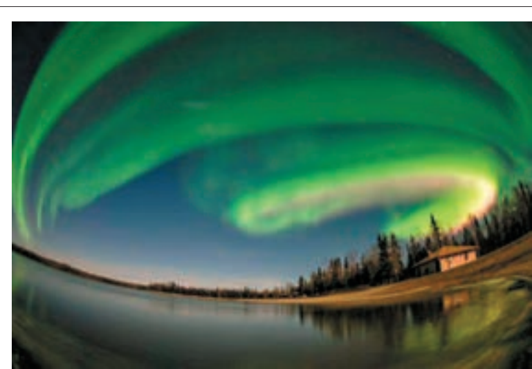
本港女攝影師Li Na Ngan憑在美國阿拉斯加拍下的北極光照片。

一般監察站錄得空氣污染物,包括可吸入懸浮粒子(PM10)、微細懸浮粒子(PM2.5)、氮氧化物、二氧化硫及臭氧,濃度按年跌2%至15%,僅一氧化碳較前年增11%。不過,來自汽車及電廠排放的廢氣二氧化氮大部分區域超標,僅大埔、沙田及東涌合格。一般監察站錄得平均濃度為每立方米47微克;路邊監測站每立方米82微克。