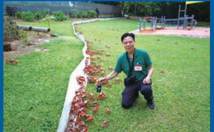
香港著名城市競爭力研究學者桂強芳

2016年末,享有「走遍全球第一人」美譽的香港著名城市競爭力研究學者桂強芳圓滿結束32天的行程,返回香港,這是他2016年最後一次對全球國家和城市競爭力考察之旅。此次行程後,桂強芳再創世界記錄,將足跡遍佈全球227個國家和地區、1,138個城市。