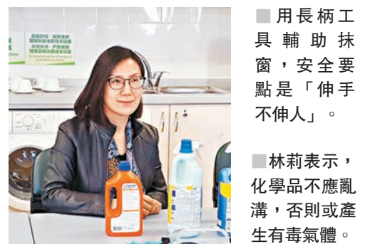
用長柄工具輔助抹窗,安全要點是「伸手不伸人」。