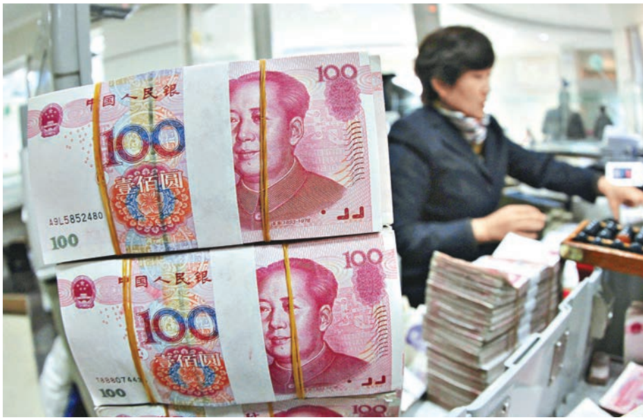
■ 彭博消息指官方預案包括必要時繼續減持美國國債，維護人民幣匯率穩定。 資料圖片

知情人士指，監管部門已經鼓勵部分國有企業對經常項目項下外匯收入進行結匯。知情人士又稱，部分恢復強制結匯已列入官方應對匯率風險的預案。這一預案是官方通過模型、壓力測試和調研，在對