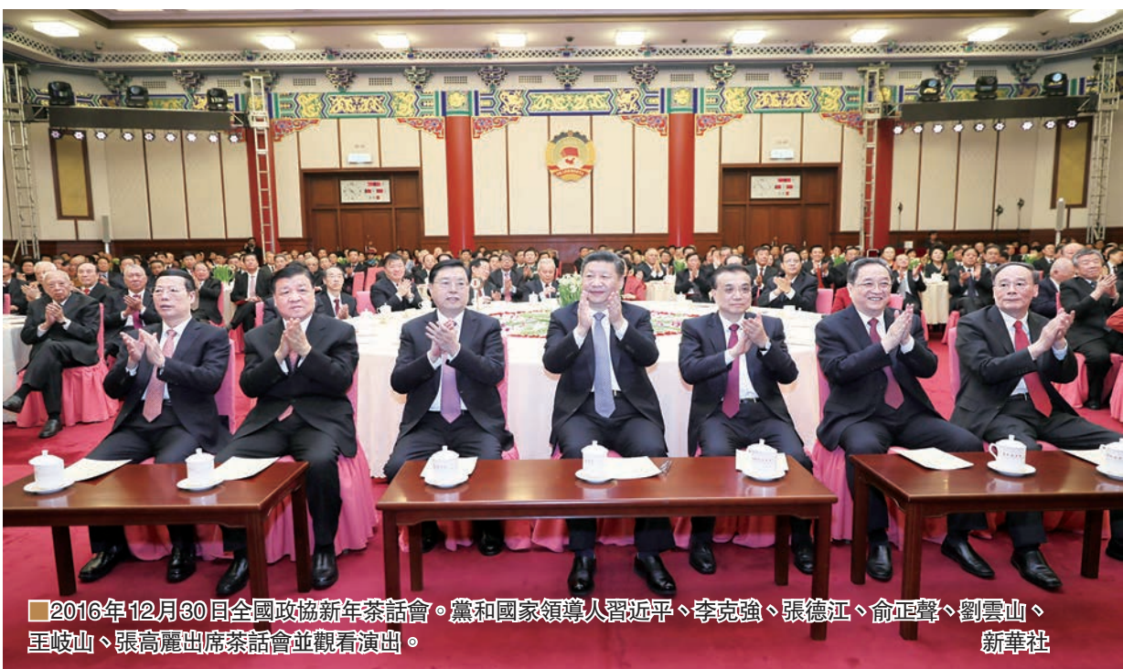
2016年12月30日全國政協新年茶話會。黨和國家領導人習近平、李克強、張德江、俞正聲、劉雲山、王岐山、張高麗出席茶話會並觀看演出。新華社