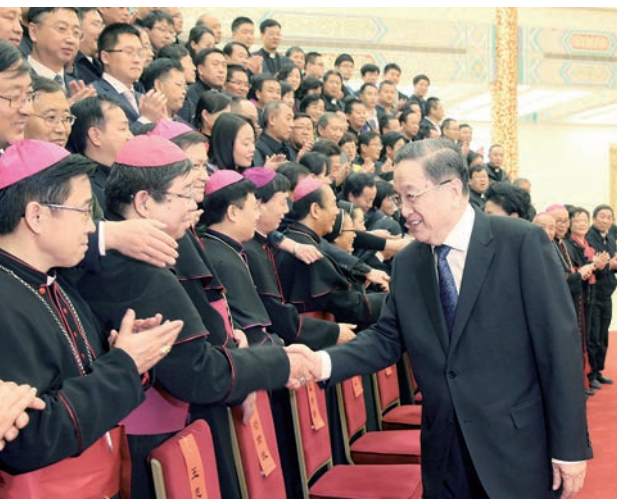
2016年12月29日,中共中央政治局常委、全國政協主席俞正聲在北京人民大會堂會見中國天主教愛國會、中國天主教主教團新一屆領導班子成員,並與出席中國天主教第九次全國代表會議的代表合影留念。

俞正聲強調,希望新一屆領導班子繼承和學習天主教界老一輩愛國人士的崇高品質,不斷開創中國天主教事業新局面。要繼續發揚愛國愛教的優良傳統,推動中國天主教更好地融入國家、適應社會、造福人群,做到愛國和愛教的有機統一。要團結帶領廣大信教群眾積極投身於中國特