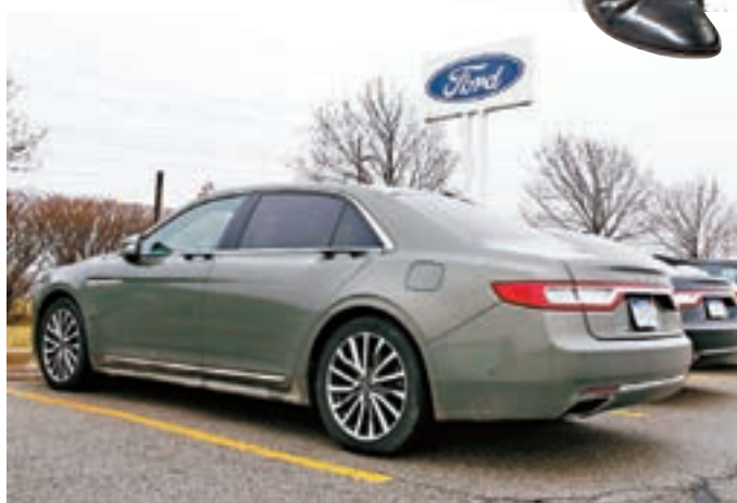
福特原計劃斥資16億美元在墨西哥設廠，將旗下「Focus」生產線搬到當地生產。