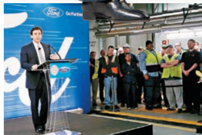
福特總裁菲爾德在弗拉特羅克工廠宣佈取消墨國設廠消息，工人聞訊歡呼。