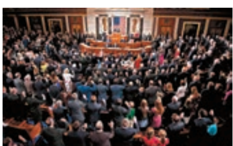
新一屆美國國會議員宣誓。

另一方面，總統奧巴馬視醫保改革法案為他任內主要政績，但共和黨人表明會在國會推翻。奧巴馬昨日前往國會，與民主黨參眾議員會面，討論如何捍衛奧巴馬醫保。儘管共和黨人反對立場清晰，但對於如何改革意見不一，眾議院議長瑞安建議