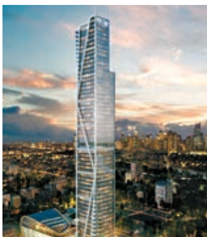
菲律賓的特朗普世紀大廈，受到武裝組織「阿布沙耶夫」威脅。

特朗普部分物業位於高危國家，包括土耳其伊斯坦布爾的特朗普大廈。土耳其去年頻頻發生恐襲，伊斯坦布爾元旦日剛爆發槍擊案，當地的特朗普大廈的恐襲風險極高。此外，菲律賓馬尼拉的特朗普世紀大廈，亦受到與極端組織「伊斯蘭國」(ISIS)有聯繫的當地武裝組織「阿布沙耶夫」威脅。