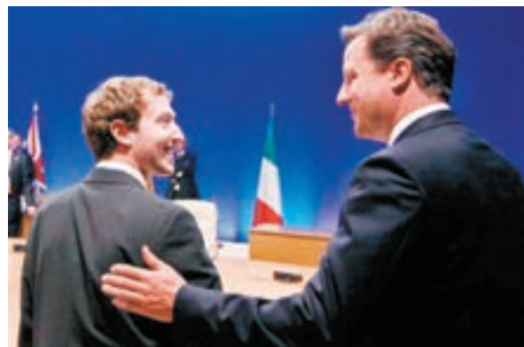
朱克伯格(左)曾與前英國首相卡梅倫會面。

社交網站facebook(fb)總裁朱克伯格前日宣佈其2017年大計，計劃今年內走訪全美所有州份，與更多人傾談生活、工作及思考未來的問題。外界揣測朱克伯格的計劃，似要為從政鋪路。