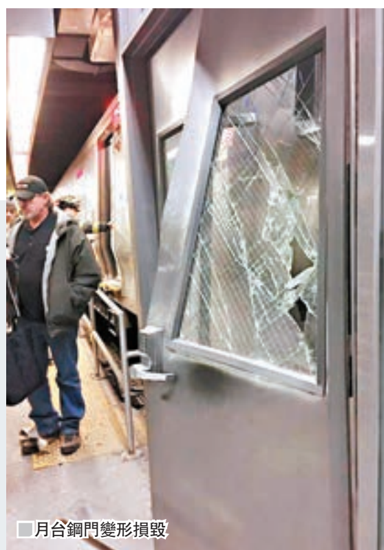
月台鋼門變形損毀

美國紐約長島鐵路(Long Island Rail Road)一輛列車，昨日早上繁忙時間在布魯克林的大西洋車站出軌，造成76人受傷，全部傷者均受輕傷，被送到一個臨時分流中心，接受救護人員治理。