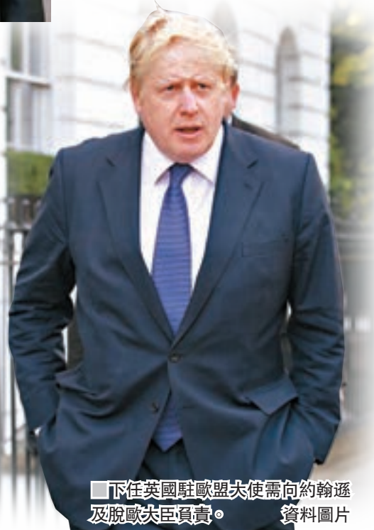
下任英國駐歐盟大使需向約翰遜及脫歐大臣負責。資料圖片