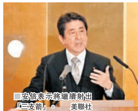
安倍表示將繼續射出「三支箭」。

日本首相安倍晉三昨日在今年首場記者會上表示，政府今年仍以經濟為最優先事務，會爭取國會盡快通過今年度財政預算案，他又指無意解散眾議院提前大選。