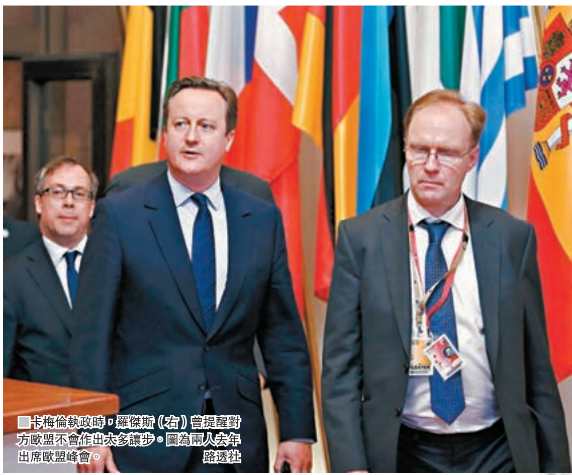
卡梅倫執政時，羅傑斯(右)曾提醒對方歐盟不會作出太多讓步。圖為兩人去年出席歐盟峰會。