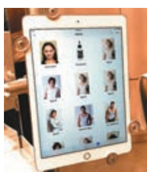
■kr點·線·面載有不同的面形，以供大家參考。

kr+更創立新一代的頭髮護理服務，讓你以髮·型書(kr+ Look-book)及kr點·線·面(kr Face Matrix)主宰自己的髮型。如果你不清楚自己適合什麼髮型，可以利用點·線·面尋找最適合自己面形的髮型。