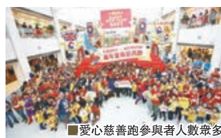
■愛心慈善跑參與者人數眾多