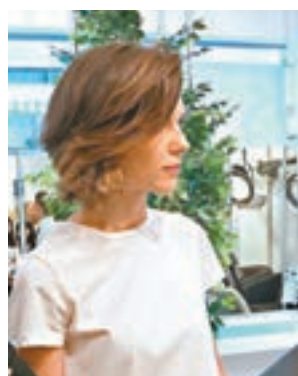
■短髮都可以很有層次感