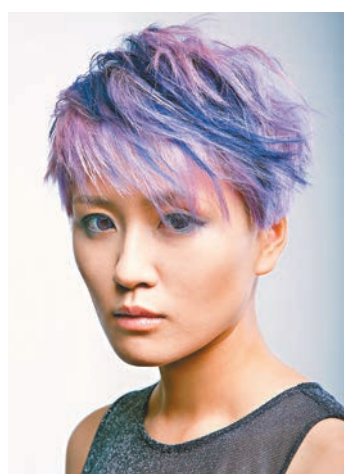
■神秘薰紫，設計靈感來自神秘的紫色，耀眼而不媚俗，演繹出女士的靈性與生命力，不同層次的紫色更顯精緻有趣，呈現出女士嫵媚性感又帶獨立個性。