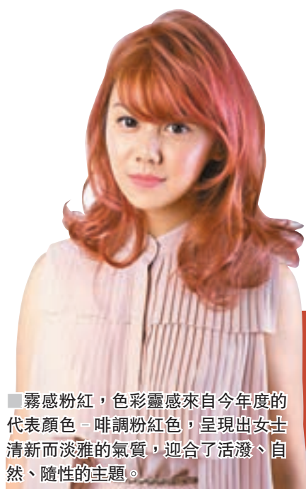
霧感粉紅，色彩靈感來自今年度的代表顏色 - 啡調粉紅色，呈現出女士清新而淡雅的氣質，迎合了活潑、自然、隨性的主題。