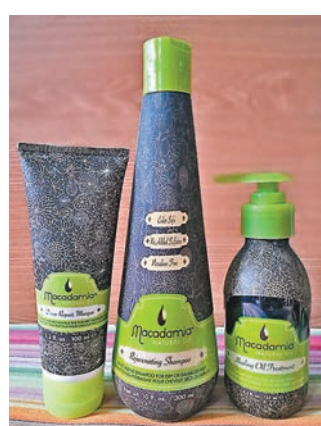
■天然秀髮護理系列

全新的天然秀髮護理系列蘊含PRO OIL COMPLEX天然夏威夷果仁油及摩洛哥堅果油，能令髮絲質感到重生，秀髮富有健康的光澤及彈性外，它的保濕因子能被迅速吸收，為髮絲帶來微妙的觸感。在任何的天氣環境下，任何髮質都易於打理。