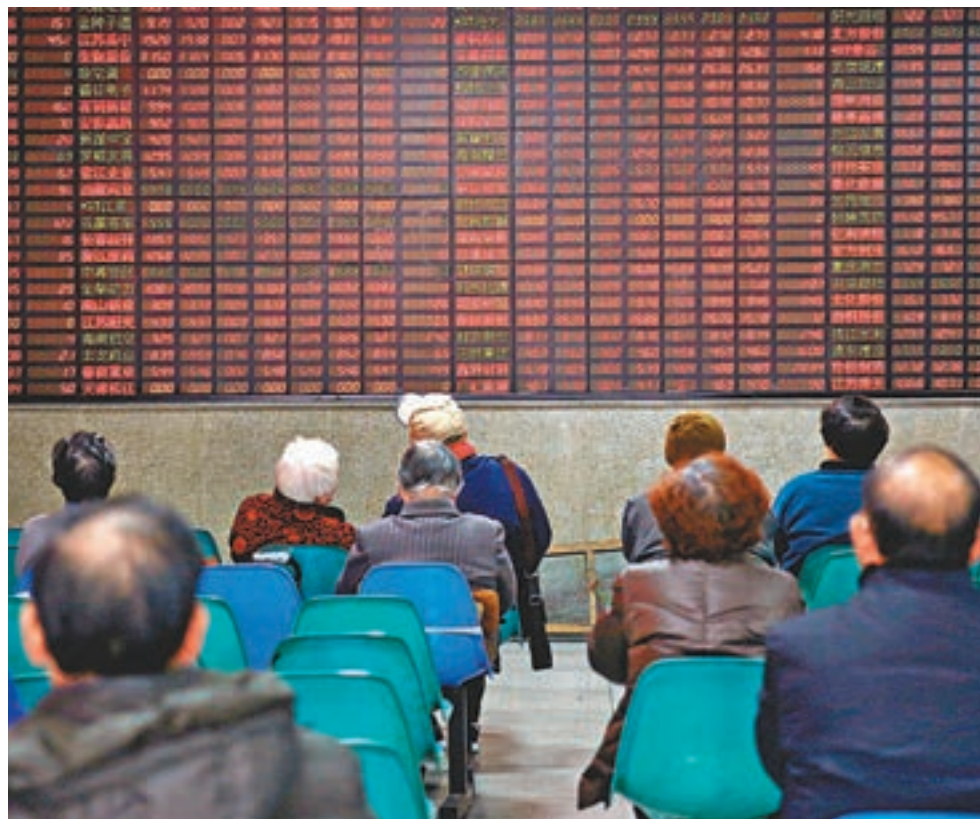
▲A股新年首戰振奮人心,三大股指全線收紅,迎來開門紅。

尚不明確,成交較少顯示觀望氣氛沒有消除,預計短期滬綜指將繼續在3,100點附近。