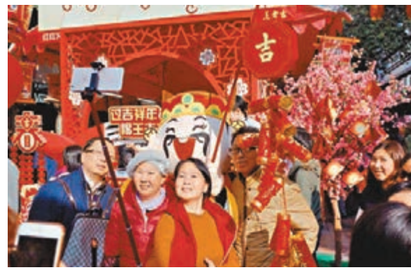
廣州往年過新年的盛況。

廣州昨日開啟霸氣邀約模式，在北京、上海、江蘇南京、四川成都等8個城市的主流媒體上，同一時間廣下「英雄帖」，以熱情洋溢的姿態，誠邀賓客到花城看花，感受羊城過年的「花樣年華」。