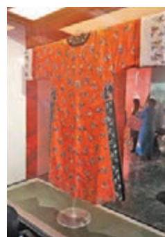
運用「中國紅」的中國傳統服飾。

「2017感受色彩」中國蘇州絲綢文化創意活動昨日在江蘇蘇州開幕，而首個展示中國傳統色彩文化的展館「中國傳統色彩博物館」亦正式開幕。據悉，該館旨在通過挖掘豐富的中國傳統色彩理論知識和實地調研，以多樣的形式在展館中展現中國傳統色彩文化的精粹，同時，首個「中國紅」色彩展亦開幕。