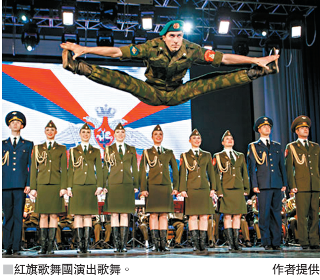
紅旗歌舞團演出歌舞。

2009年是新中國成立60周年，當年9月紅旗歌舞團再度來華共襄盛典，巡演京、津、穗、渝、滬等地。9月20日晚，筆者在廣州中山紀念堂欣賞了該團120人強大陣容的晚會。當大幕開啟，歡快的舞姿和絢麗的服飾凸顯風情萬種的俄羅斯特色，禮堂當即響起熱烈掌聲。一曲曲氣勢磅礴的合唱和熱情奔放的舞蹈，激揚著英雄主義的浪漫色彩，「水兵舞」、「戈巴克舞」、「哥薩克騎兵舞」、「節日進行曲」等等再現蘇聯當年的光榮與夢想，騎兵舞凌空騰躍的高超技藝和女子舞蹈飛速旋轉的熱情奔放令我歎為觀止；三角琴、巴揚手風琴等俄羅斯民間樂器也為演出平添無窮魅力，當《長征》、《茉莉花》等中國歌曲響起，全場觀眾更是神采飛揚倍感親切，台上台下形成和聲，掌聲喝彩響成一片，散場後不少人還等待與歌舞團演員簽名合影、握手擁