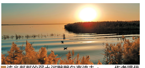
波光粼粼的弱水河默默向東流去。

到額濟納第二天下午，我們慕名來到離弱水河道約二十公里的「怪樹林」。怪樹林方圓數十里，原來這裡是茂密的胡楊林，因河流通改乾涸，成千上萬枯死的胡楊，屹立在廣袤的大漠荒灘，構成一幅獨特神秘的景觀。當夕陽染紅天際，用逆光拍攝這些枯死上百年仍屹立不倒的胡楊樹，捕捉蒼涼、冷峻、怪異的畫面，使怪樹林成為拍友的天堂。遊怪樹林的高潮是看落日，在天與地相接的沙漠荒原，數百上千計的遊客登上山丘，欣賞火球般的太陽慢慢西沉，最後消失在地平線，天邊留下一抹殘霞，那一刻的感受，是千金難買的體驗。