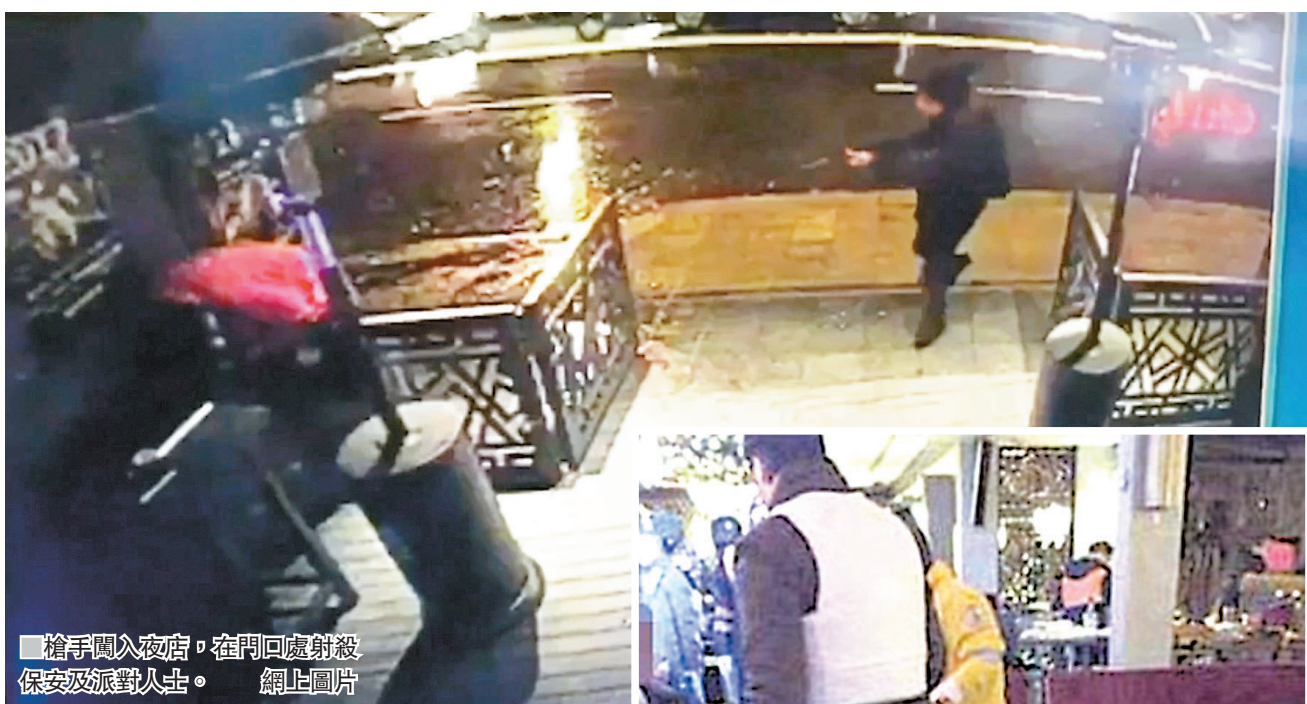
槍手闖入夜店，在門口處射殺保安及派對人士。