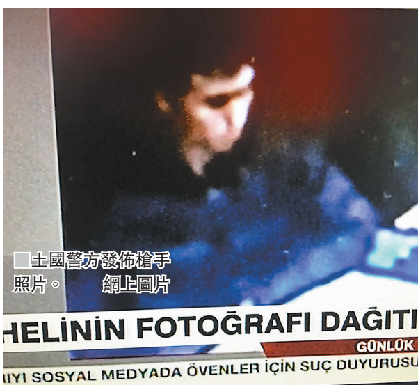
土國警方發佈槍手照片。網上圖片

HELİNİN FOTOĞRAFI DAĞITI GÜNLÜK İYİ SOSYAL MEDYADA ÖVENLER İÇİN SUÇ DUYURUSU