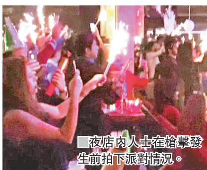
夜店內人士在槍擊發生前拍下派對情況。