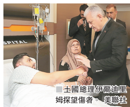
土國總理伊爾迪里姆探望傷者。