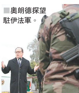
奧朗德探望駐伊法軍。