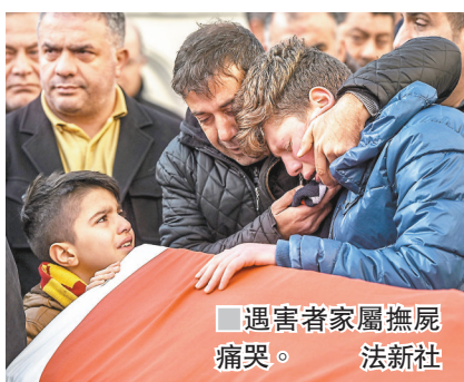
遇害者家屬撫屍痛哭。