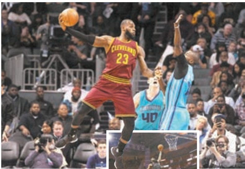
勒邦占士(左)強行突破。

俄克拉荷馬雷霆當天以114:88擊退洛杉磯快艇。當家球星韋斯布魯克全場貢獻17分、14次助攻和12個籃板，這是他賽季第16次拿到「三雙」，成為雷霆獲勝關鍵。韋斯布魯克當天僅打了28分鐘便提前休戰，因為雷霆在半場結束時已經以69:40大比分領先。根達拿到雷霆最