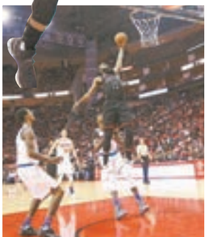
夏頓輕鬆上籃。