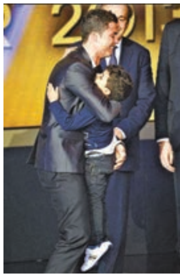
C朗望兒子成為足球員。