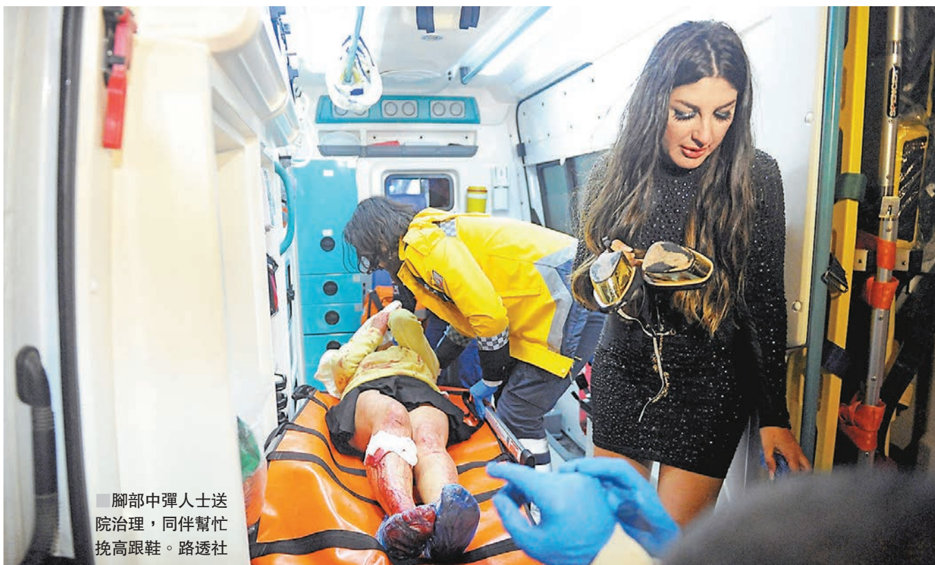
腳部中彈人士送院治理，同伴幫忙挽高跟鞋。

事發於當地時間昨日凌晨1時15分，槍手在奧爾塔柯伊區夜店「Reina」門外，先槍殺保安和一名平民，再闖入店內大開殺戒，當時店內約有700人參加派對。由於夜店靠近博斯普魯斯海峽，很多人聽到槍聲，急得衝出夜店跳海保命，海岸防衛隊立即救援。