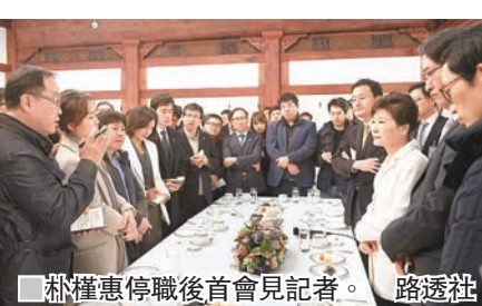
朴槿惠停職後首會見記者。

朴槿惠又否認信崔順實干政的指控，表示作為總統很清楚該履行的職務，也有自己的想法，雖然崔順實是她相識多年的好友，但不可能由崔順實包辦所有事情。她同時否認在三星物產和第一毛織合併過程中涉嫌受賄。