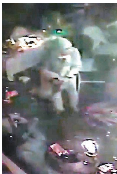
店內閉路電視拍到槍手換裝離開。網上圖片