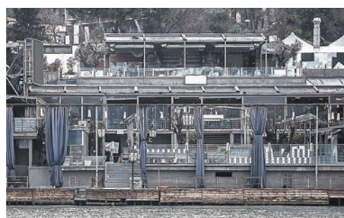
事發夜店沿岸，派對人士跳海逃生。