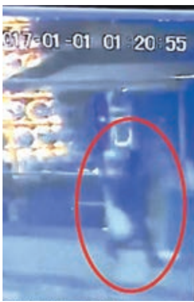
槍手闖入夜店一刻。