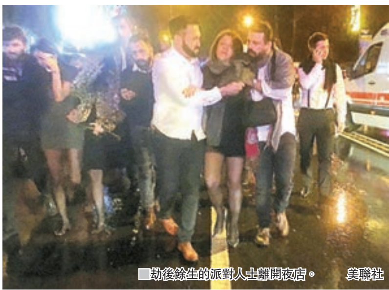
劫後餘生的派對人士離開夜店。