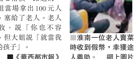
淮南一位老人賣菜時收到假幣，幸獲途人義助。