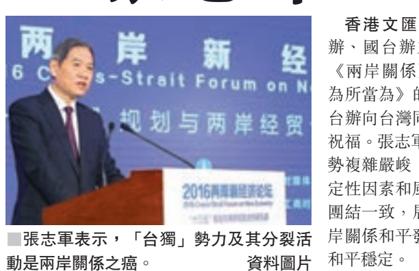
張志軍表示，「台獨」勢力及其分裂活動是兩岸關係之癌。

香港文匯報訊 據新華社報道，中台辦、國台辦主任張志軍在2017年第一期《兩岸關係》雜誌發表題為《把握大局為所當為》的新年賀詞，代表中台辦、國台辦向台灣同胞致以節日的問候和新年的祝福。張志軍指出，展望2017年，台海局勢複雜難峻，兩岸關係發展面臨許多不確定性因素和風險。我們衷心希望兩岸同胞團結一致，展現決心和勇氣，牢牢把握兩岸關係和平發展正確方向，努力維護台海和平穩定。