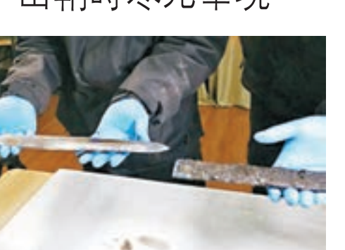
河南近日出土一把帶着劍鞘的古劍。

河南省文物考古研究院日前表示，在該省信陽城陽城遺址第18號楚墓的發掘工作中，近日出土的木棺內藏一把2,300多年前的寶劍，還帶着劍鞘。考古人員小心翼翼、一點點把寶劍從劍鞘裡抽出來，寶劍從劍鞘裡抽出來的那一剎那，竟還帶着寒光。千年寶劍出鞘，寒光一現，誰與爭鋒。 《央視新聞》