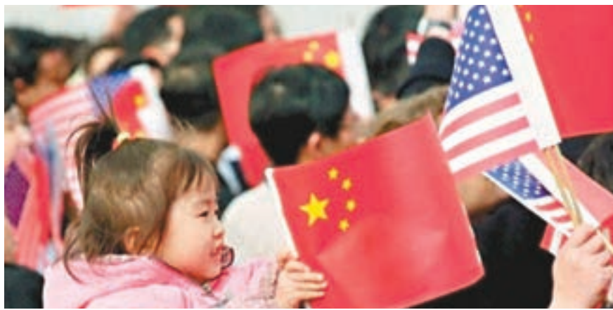
學者警告若特蔡會面成事，將直接危害中美關係的發展。

香港文匯報訊 綜合環球時報網、觀察者網報道，美國候任總統特朗普表示，對與台灣地區領導人蔡英文會面持開放態度。本月20日正式宣誓就職的特朗普，除夕夜在佛羅里達州大宅舉行派對，被記者問到上任後是否與蔡英文會面時表示，會讓事情順其自然發展。蔡英文將於本週六出訪中美洲四國，會先後過境美國的休斯頓及三藩市。南京大學台灣研究所所長劉相平指，如果特朗普與蔡英文見面，將不再被視為「意外」，而是被視為對一中政策的故意挑釁。