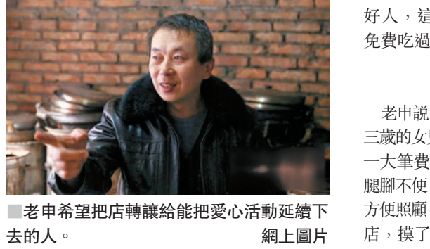
老申希望把店轉讓給能把愛心活動延續下去的人。

家有老少待照顧 老申說：「我家的戶口在文藝路附近，三歲的女兒今年要上學，若跨學區上要交一大筆費用。另外，我父母都80歲了，腿腳不便，我也應搬回去和老人住一起，方便照顧。」老申說着，環顧了一眼煎餅店，摸了摸放在爐子上的平底鍋。 老申說：「希望把店轉讓給一個能繼續賣煎餅，並能把給周圍低保戶的愛心活動延續下去的人，也算我的心願。」老申表示，幾個月前他就琢磨着把店轉讓出去，但一直堅持到2016年最後一天。「這算我對自己的有始有終吧。2017年，一切都得有個新開始，希望煎餅店在新主人的經營下越來越好，把愛心繼續傳遞。」