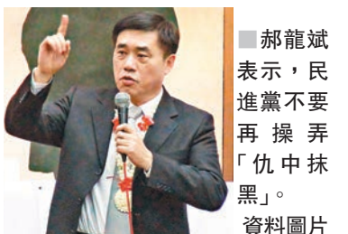
郝龍斌表示，民進黨不要再操弄「仇中抹黑」。

香港文匯報訊 據台灣中央社報道，中國國民黨副主席郝龍斌昨天說，蔡英文批評對岸走回威權恫嚇的老路，但兩岸關係是取決於雙方的自制與善意，蔡英文應要求黨內不要操弄「仇中抹黑」的老路，以免讓兩岸關係更險峻。 談到兩岸關係，郝龍斌說，兩岸關係是取決於雙方的自制和善意，過去八年兩岸關係既然平穩又友善，為什麼從民進黨執政以後才開始變化。他建議蔡英文除了呼籲北京要釋出維持尊重與善意外，也該反求諸己，重新回到「九二共識」上，並以民進黨黨主席的身份，要求黨內不要再操弄「仇中抹黑」的老路，才不會讓兩岸關係更加險峻。