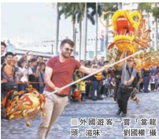
外國遊客一嘗「當龍頭」滋味。