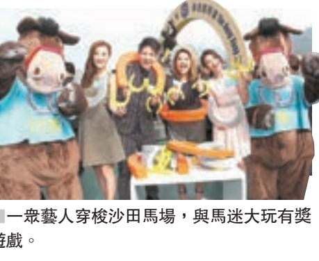
一眾藝人穿梭沙田馬場，與馬迷大玩有獎遊戲。

香港賽馬會昨日在沙田馬場舉辦《好運1月1賽馬日》，期望市民大眾新年在馬場踏出好運第一步，贏取豐厚獎賞，入場市民均可獲贈好運匙扣一個。昨日天公作美，氣溫回暖，不少本地馬迷、內地及海外旅客均入場觀賞賽事兼賀元旦，令沙田馬場內人聲鼎沸，洋溢一片節日氣氛。 8.6萬人次進場 15.77億投注額