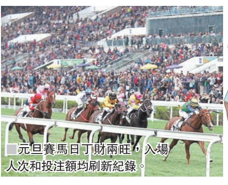
元旦賽馬日丁財兩旺，入場人次和投注額均刷新紀錄。

香港文匯報訊（記者 聶曉輝）新年伊始，香港市面洋溢一片熱鬧氣氛，不少市民則選擇與三五知己入馬場觀賞賽馬，同時希望賺取一筆橫財為新年打響頭炮。沙田馬場昨日上演11場元旦日賽事，共吸引86,606人次進入兩個馬場觀賽，全日投注額為15.77億元，分別按年上升11.4%及1.8%，兩者均刷新元旦賽馬日的紀錄，並為香港特區政府庫房進賬1.77億元。總結全日賽事，熱門成績理想，相信為不少市民帶來一個愉快的新年。