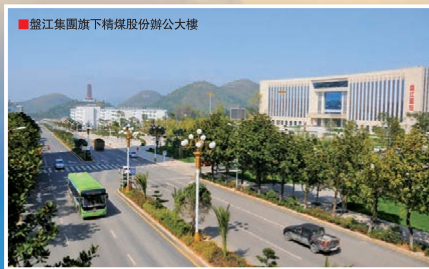
■ 盤江集團旗下精煤股份辦公大樓

「十三五」期間，盤江集團將認真踐行「創新、協調、綠色、開放、共享」新發展理念，實施「創新驅動、產融互動、協調發展」的發展戰略，着力發展「能源材料、商貿物流、金控運營、健康服務、技術服務」等五大業務，不斷提升業務價值，預計到2020年，管理資產超過千億元，業務收入超過500億元，利潤總額超過35億元。