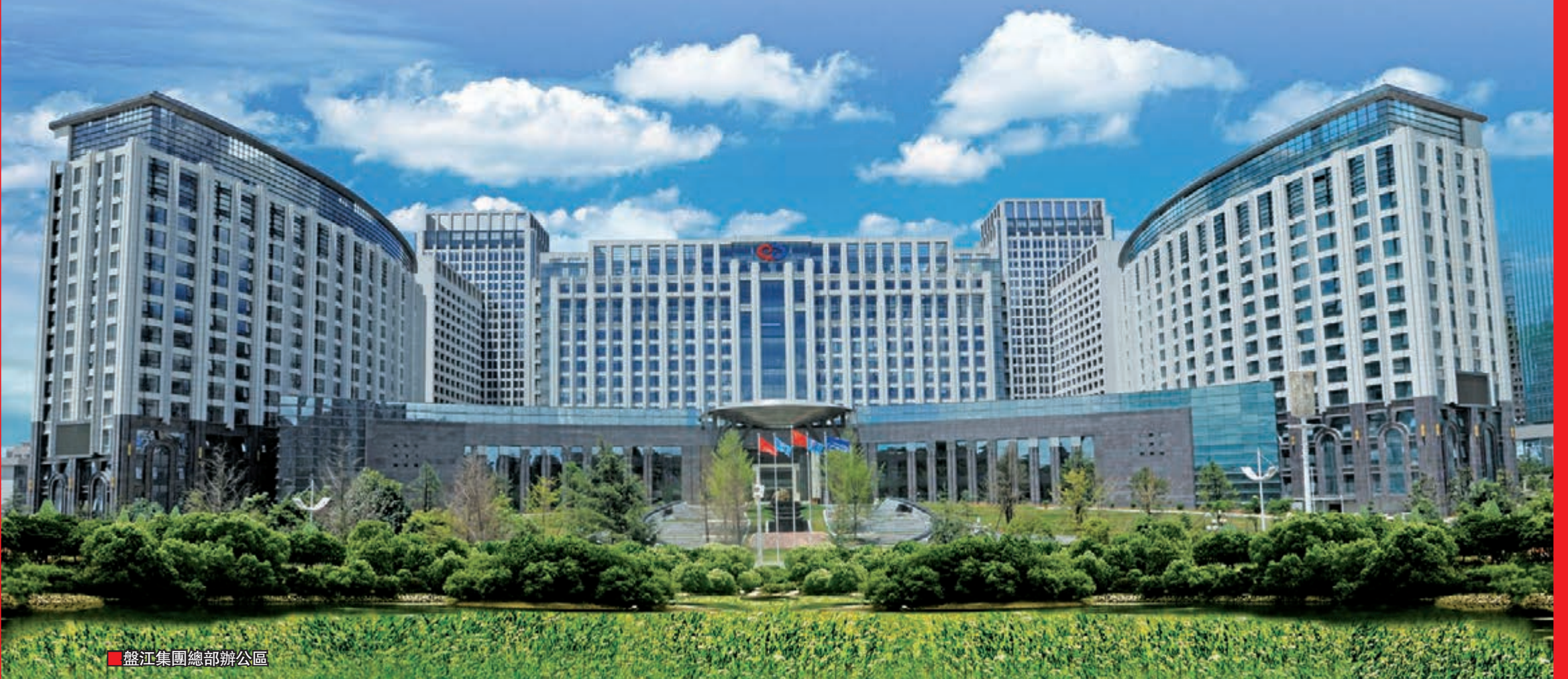
■ 盤江集團總部辦公區

盤江集團是由貴州盤江國有資本運營有限公司及其子企業組成的省屬大型企業集團。經過近半個世紀的建設、改革與發展，盤江集團已成為一家以資源能源為基礎，集產業發展、資本運營、集團管控為一體的綜合型大型企業集團。