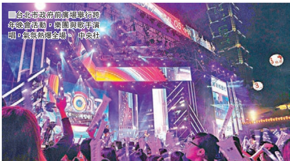
■台北市政府前廣場舉行跨年晚會活動，樂團與歌手演唱，氣氛熱爆全場。中央社