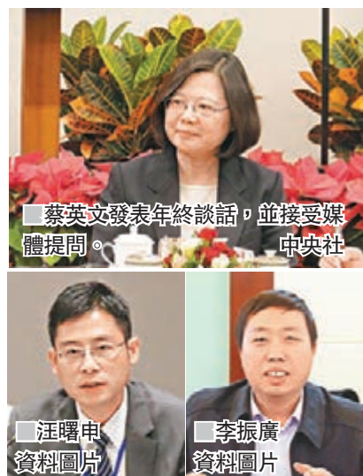
■蔡英文發表年終談話，並接受媒體提問。