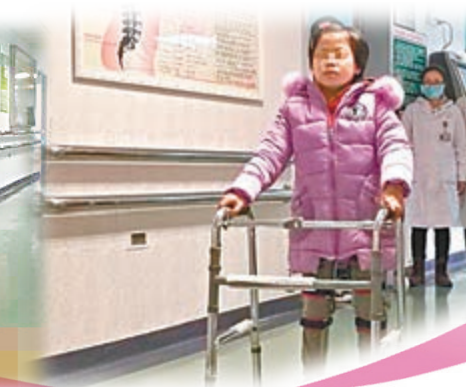
■琴琴在不用醫生幫助的情況下，自己戴上護具練習走路。網上圖片