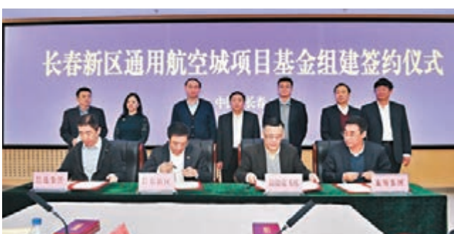
■通用航空城項目基金日前在長春新區組建簽約。

協議。溫德克「鷹」型飛機由美國溫德克飛機公司研發，是全球第一款取得美國FAA23部適航認證的全複合材料通航主流飛機。全球共13款取得FAA23部適航認證的複合材料通航飛機，有五款出自美國溫德克飛機公司。