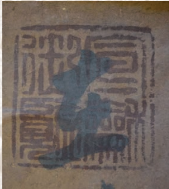
■許伯夷藏《遊目帖》收藏印